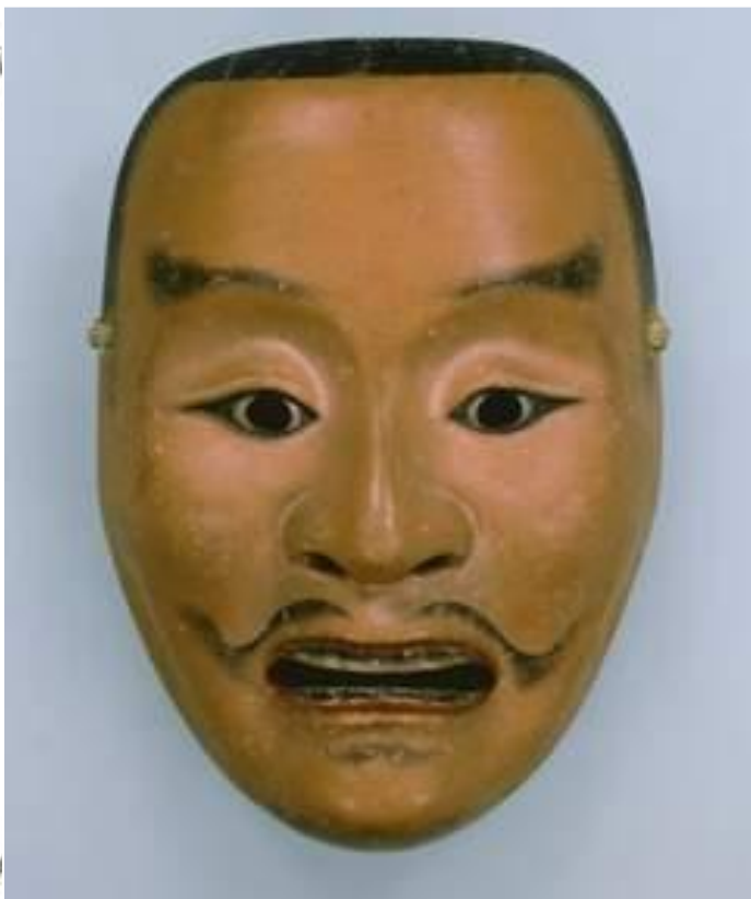
Маска театра Но ХЭЙТА