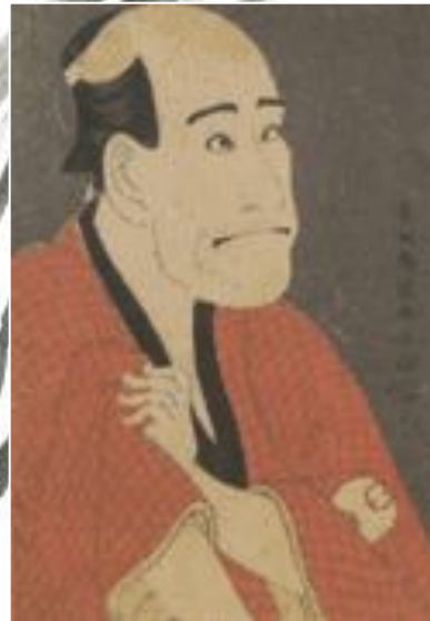
ТЁСЮСЯЙ СЯРАКУ. Актер Араси Рюцо II, 1794г., гравюра. Музей Гиме, Париж