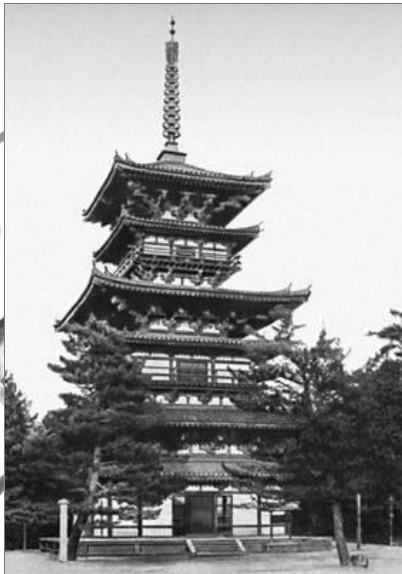
Восточная пагода монастыря Якусидзи в Наре. 7 – 8 вв.

В VIII веке была построена древняя столица Японии - Нара. Архитекторы позаимствовали симметричную структуру у китайских городов, а скульпторы создали статуи молящихся буддийски монахов, тоже навеянные китайскими образцами, сумев превзойти соседей элегантностью и художественным эффектом.