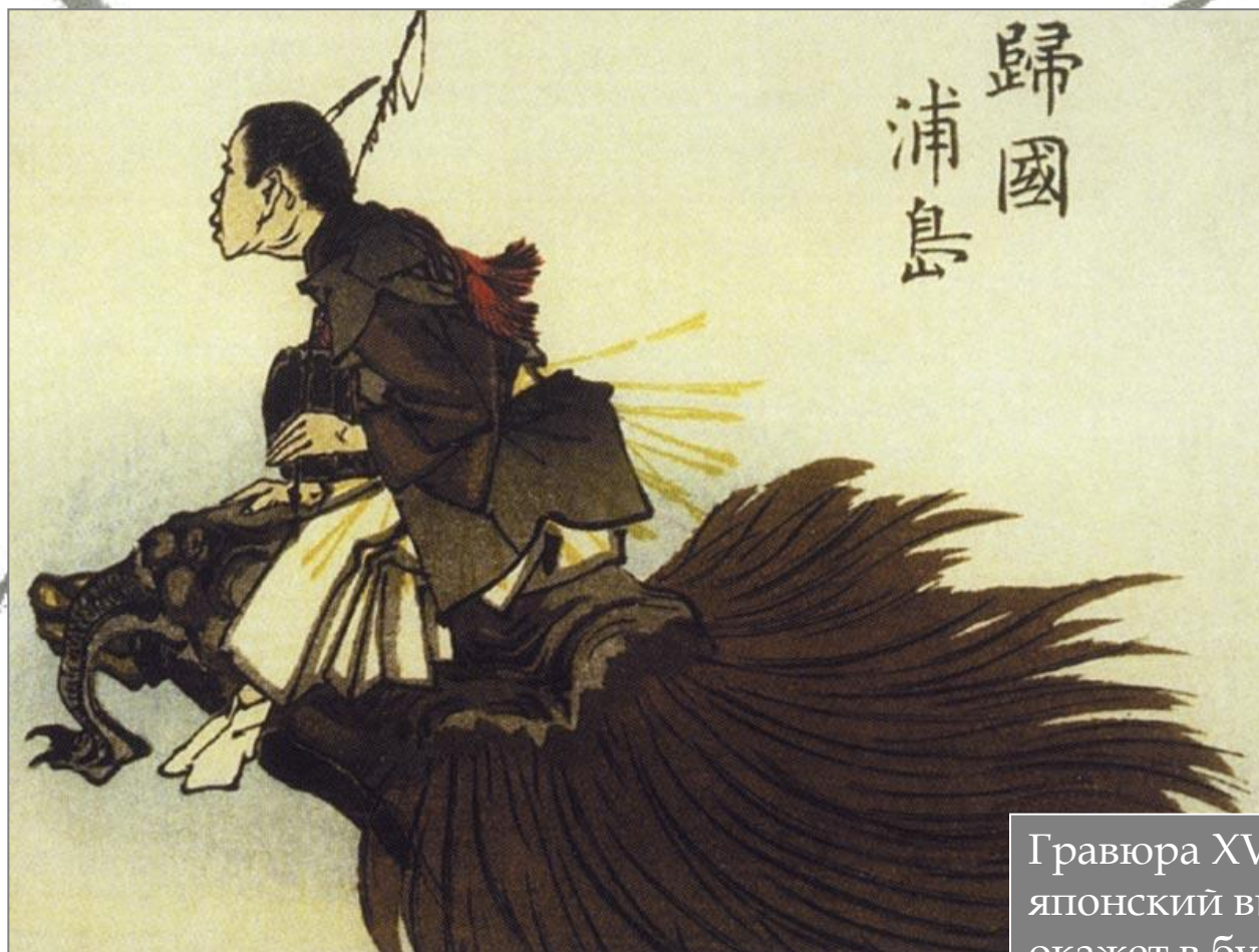
Урасима Тайсё Ёситоси, гравюра на дереве, 1882 г.

Гравюра XVIII века - это уже чисто японский вид искусства, который окажет в будущем огромное влияние на европейское изобразительное искусство, в частности на Гогена и Ван Гога.