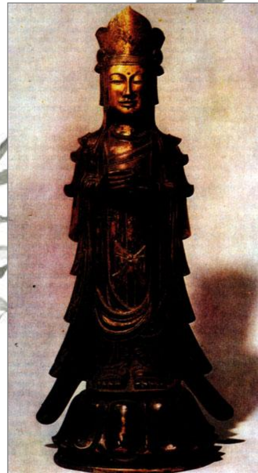
Статуя Канноп-босацу. VII в. Монастырь Хорюдзи близ Нары.

Статуи монахов из Нары мы справедливо причисляем к шедеврам искусства, хотя создание их было вызвано не художественными, а экономическими причинами. В VIII веке японские скульпторы отказались от бронзы, которая была им не по карману, и эта вынужденная экономия привела к изобретению новых художественных приемов. На деревянную или гипсовую основу накладывался слой специального лака (из смолы дальневосточного дерева сумах). Затем поверхность лака декорировалась разными способами - вставками из перламутра, росписью красками, растворенными в масле, нанесением узоров золотой и серебряной пудрой и т. д., что придавало статуям удивительную красоту и изысканность.