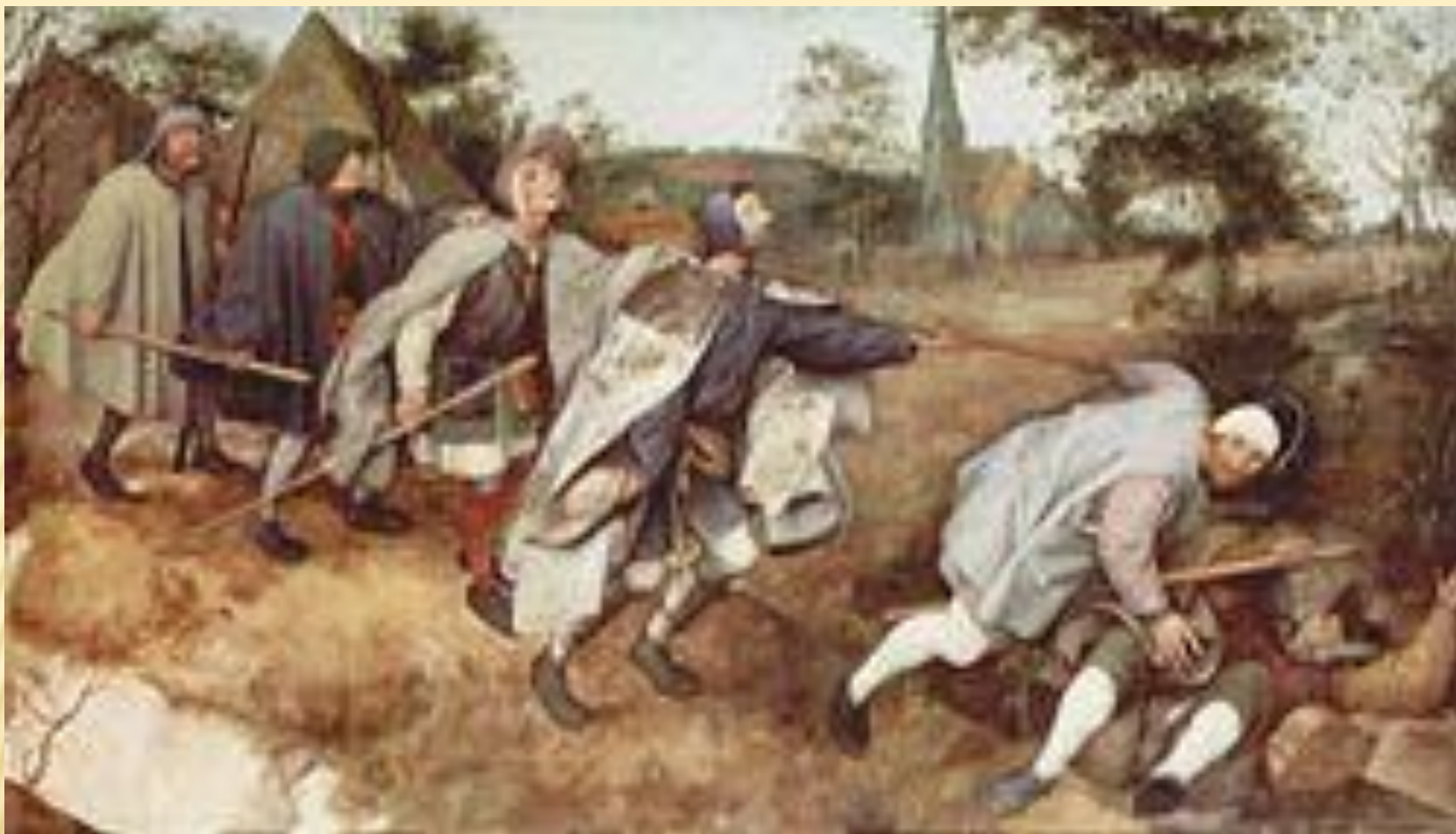
Питер Брейгель Старший, Слепые, 1568, Национальные музей и галерея Каподимонте