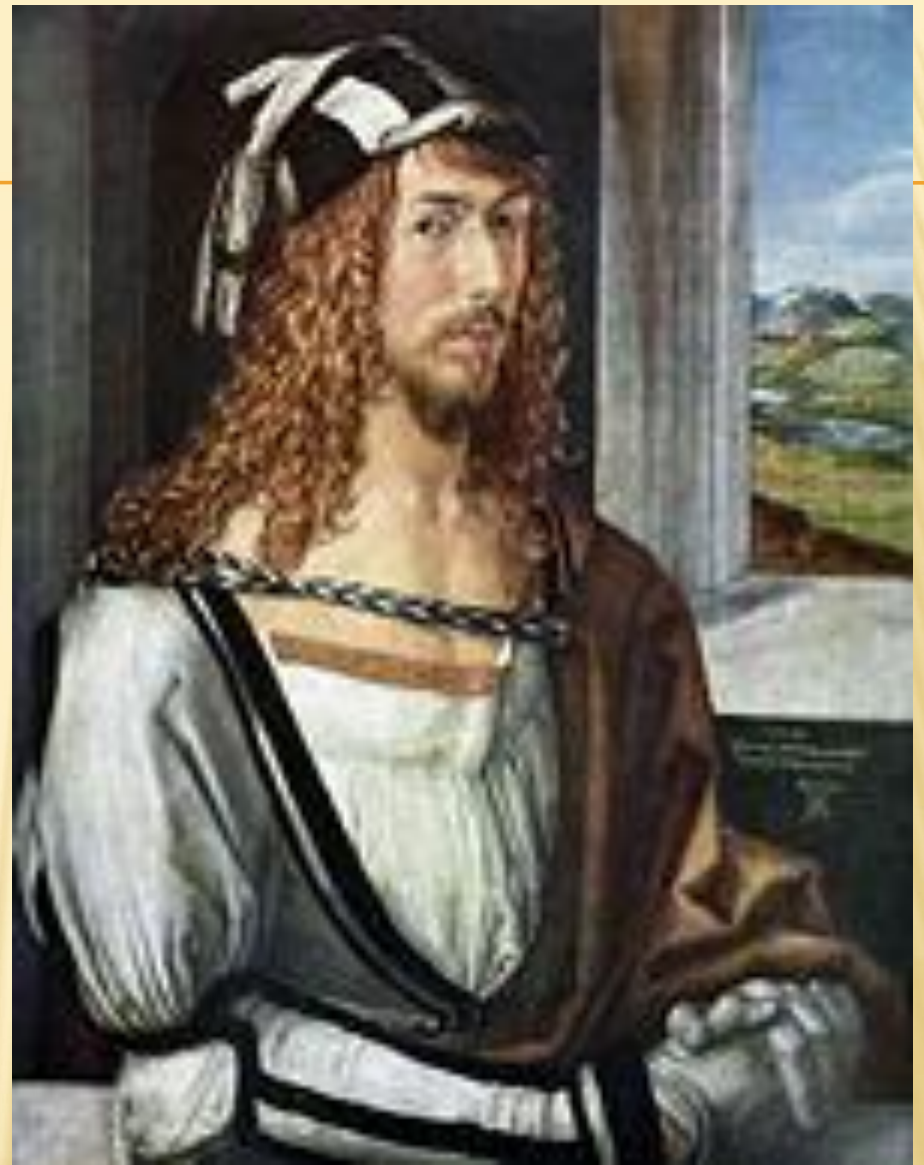
Альбрехт Дюрер, Автопортрет, 1498, Прадо, Мадрид