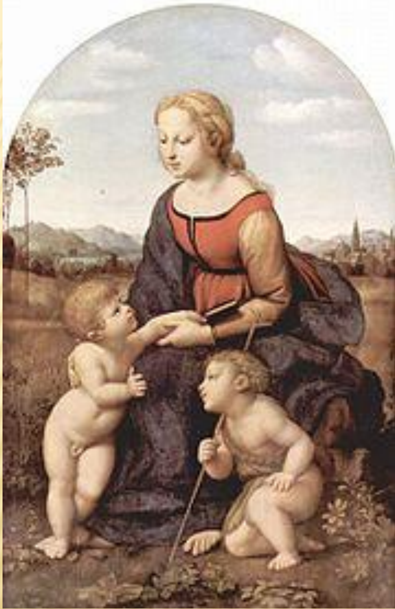
Рафаэль. Мадонна с младенцем и Иоанном Крестителем. 1507. Париж, Лувр