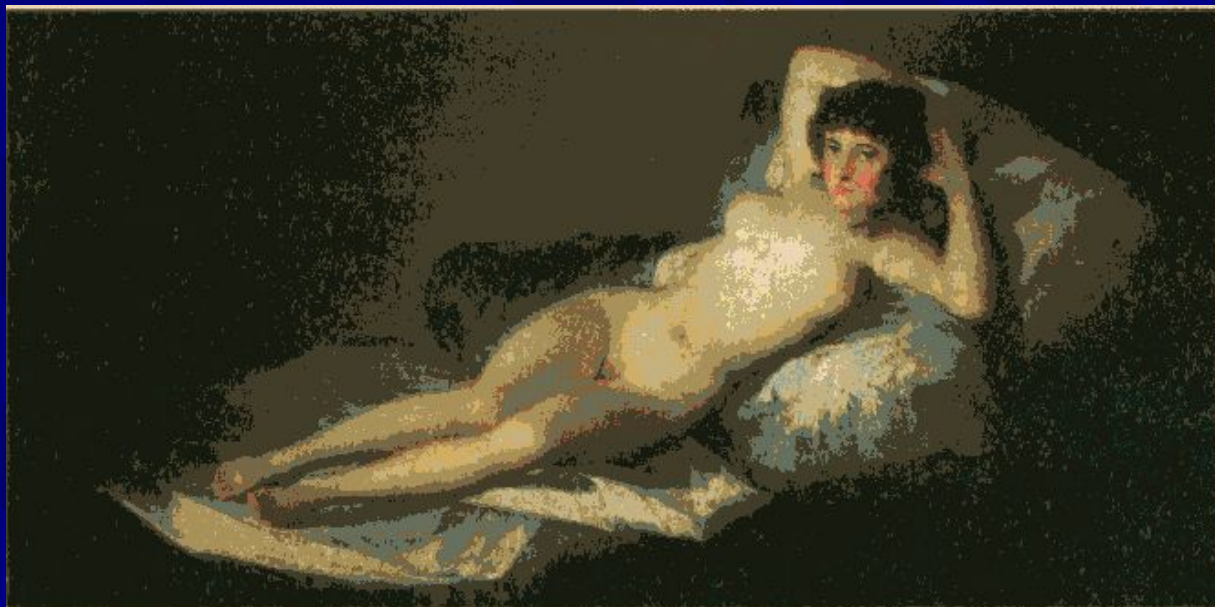
Франсиско Гойя. Обнажённая маха. Около 1802 г. Прадо, Мадрид.