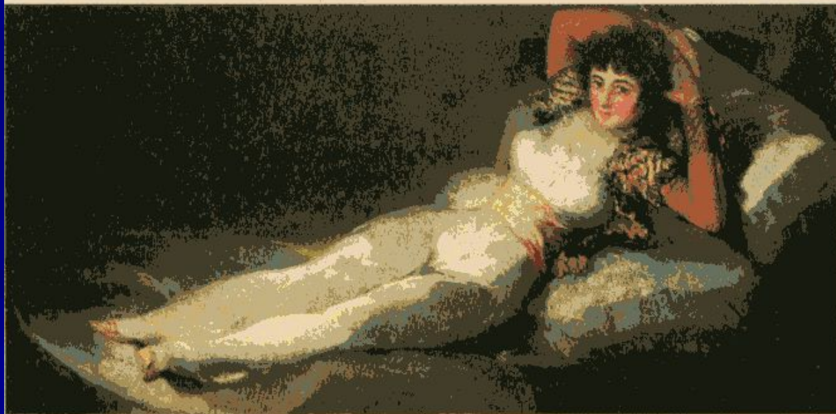
Франсиско Гойя. Одета маха. Около 1802 г. Прадо, Мадрид.