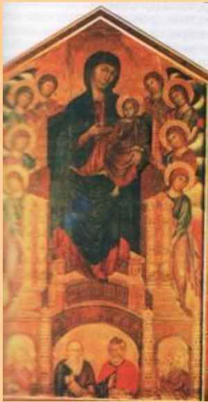
Чимабуэ Мадонна на троне