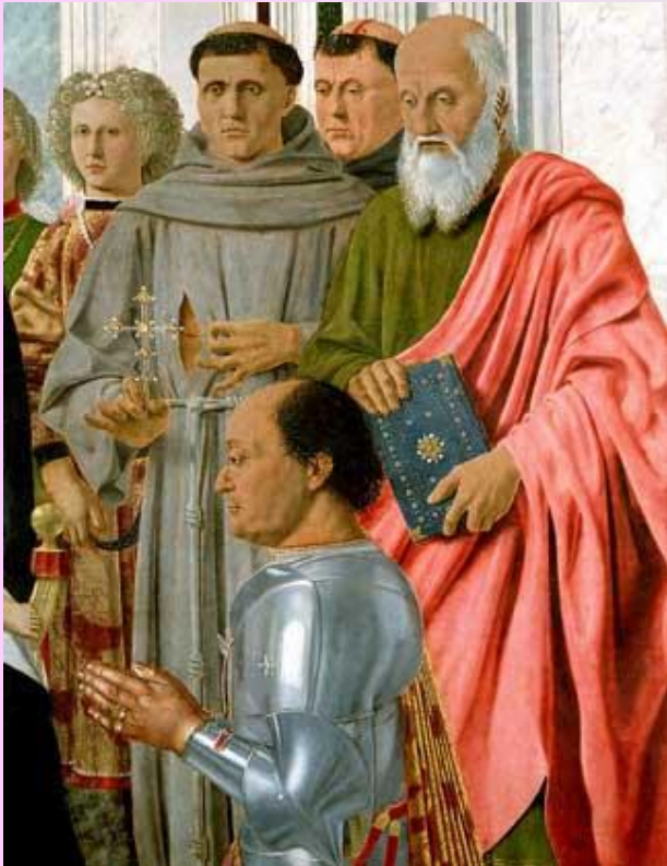
Мадонна с ангелами, святым Федерико (фрагмент)

Пьеро Делла Франческа (Piero della Francesca) (около 1420-1492)