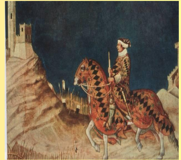
Мартини Кондотьер Гвидориччо де Фольяно