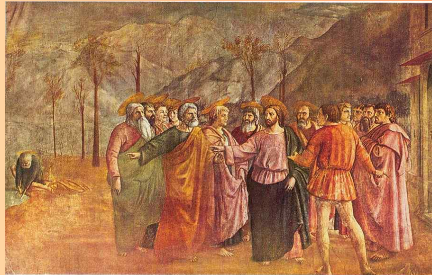
Чудо о статире

МАЗАЧЧО (Masaccio) (1401–1428), итальянский живописец флорентийской школы. Вместе с архитектором Брунеллески и скульпторами Донателло и Гиберти считается одним из основоположников Ренессанса. Своим творчеством он способствовал переходу от готики к новому искусству, прославлявшему величие человека и его мира. Значение живописи Мазаччо было вновь оценено в 1988, когда его главное творение – фрески капеллы Бранкаччи в церкви Санта Мария дель Кармине во Флоренции – были восстановлены в первоначальном виде. Мазаччо родился в провинциальном тосканском городке Кастьель-Сан-Джованни 21 декабря 1401. Его полное имя – Томмазо ди Джованни ди Симоне Кассаи (Tommaso di Giovanni di Simone Cassai). О детстве и юности художника почти ничего известно.