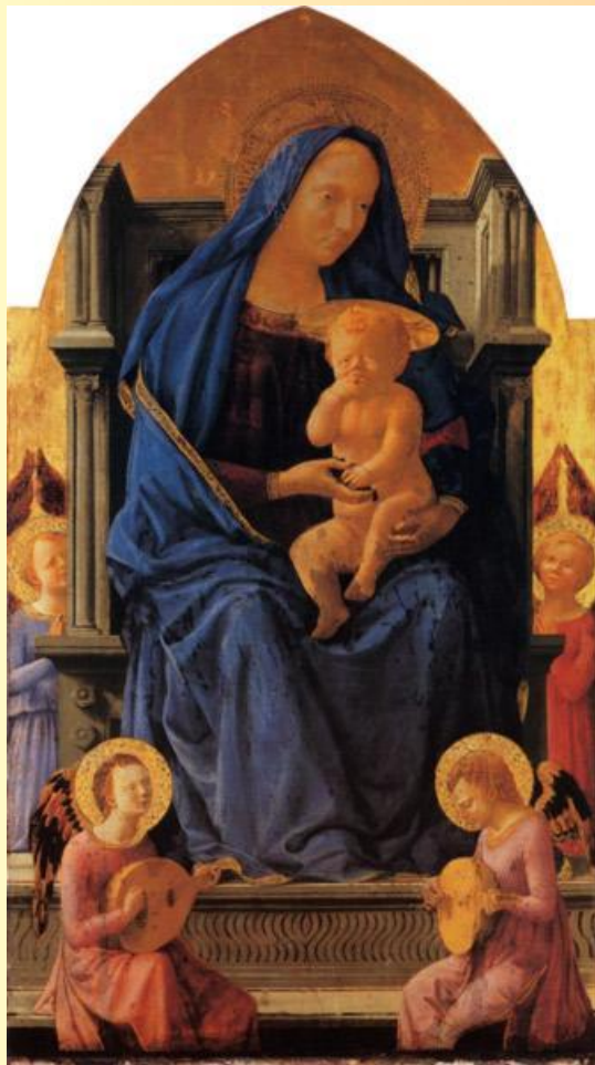
Мадонна с младенцем

МАЗАЧЧО (Masaccio) (1401–1428), итальянский живописец флорентийской школы. Вместе с архитектором Брунеллески и скульпторами Донателло и Гиберти считается одним из основоположников Ренессанса. Своим творчеством он способствовал переходу от готики к новому искусству, прославлявшему величие человека и его мира. Значение живописи Мазаччо было вновь оценено в 1988, когда его главное творение – фрески капеллы Бранкаччи в церкви Санта Мария дель Кармине во Флоренции – были восстановлены в первоначальном виде. Мазаччо родился в провинциальном тосканском городке Кастьель-Сан-Джованни 21 декабря 1401. Его полное имя – Томмазо ди Джованни ди Симоне Кассаи (Tommaso di Giovanni di Simone Cassai). О детстве и юности художника почти ничего известно.