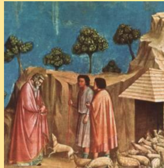
Джотто возвращение Иоакима к пастухам