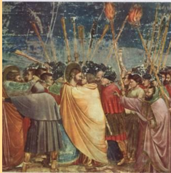
Джотто Поцелуй Иуды