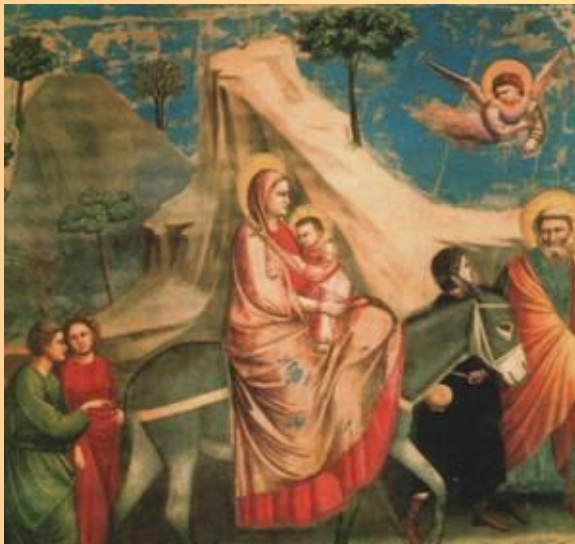
Джотто Бегство в Египет