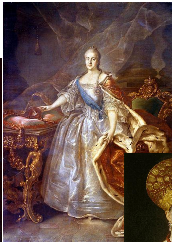
Портрет Екатерины II