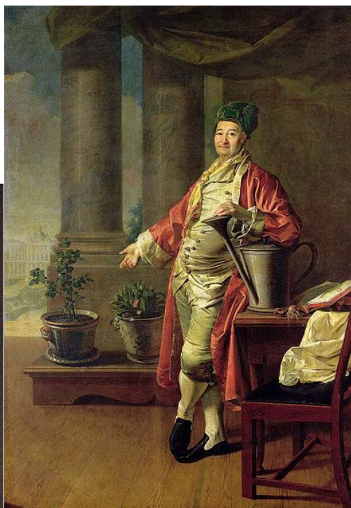
Портрет П. А. Демидова