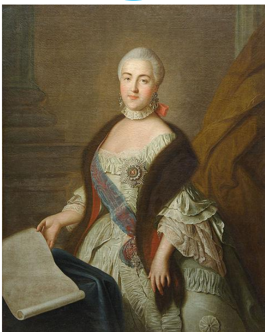
Портрет Екатерины Алексеевны