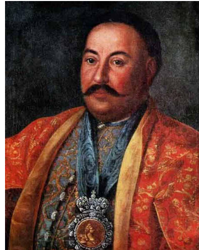
Портрет атамана Краснощёкова