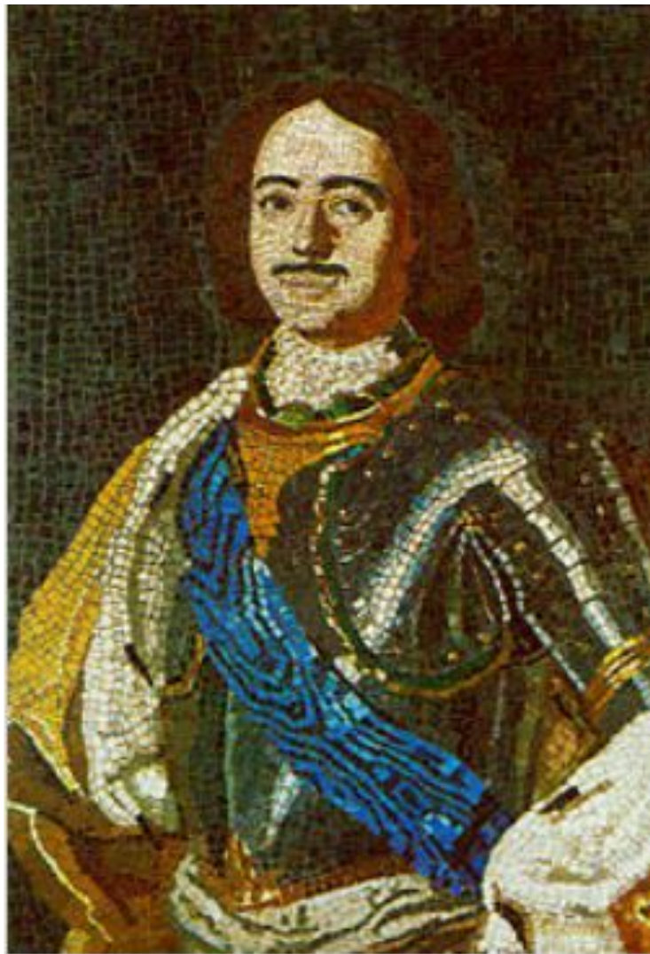
Портрет Петра I. Мозаика.