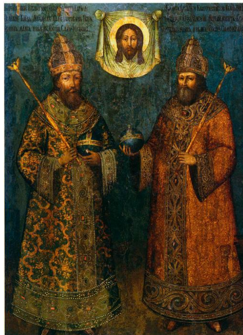
Царь Михаил Федорович и царь Алексей Михайлович, предстоящие перед образом Спаса Нерукотворного.