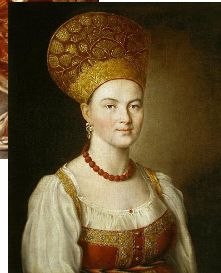
Портрет неизвестной крестьянки в русском костюме