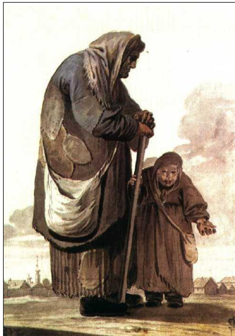
Нищая с девочкой-поводырем