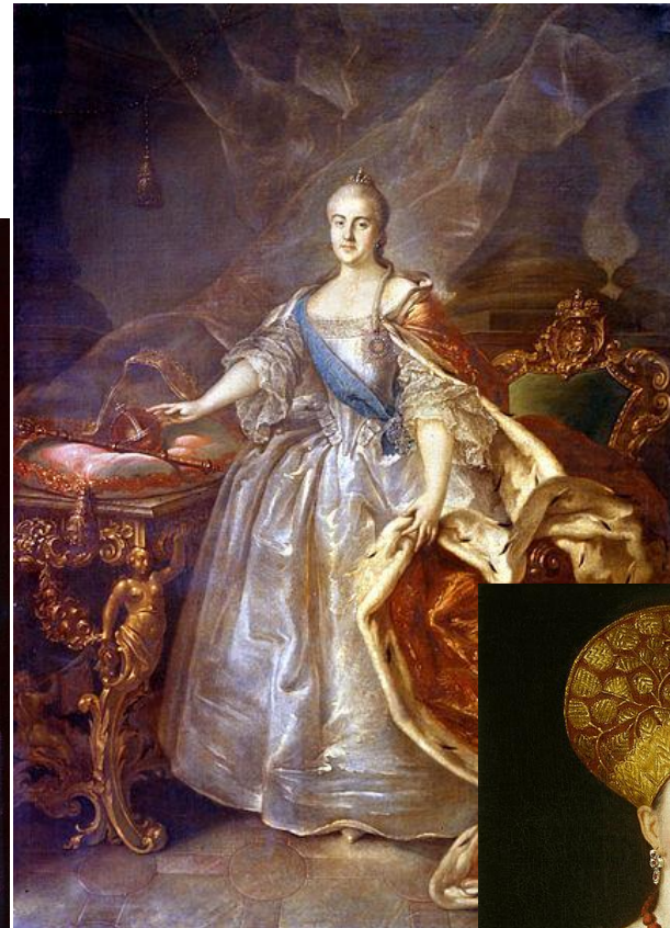
Портрет Екатерины II