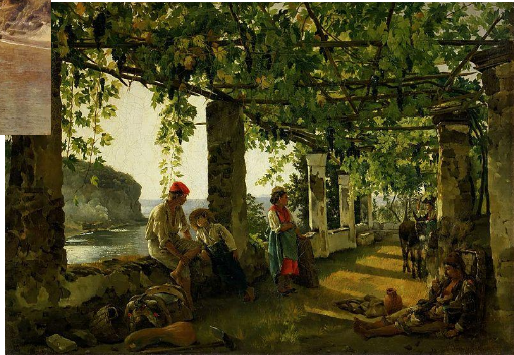
Веранда, обвитая виноградом