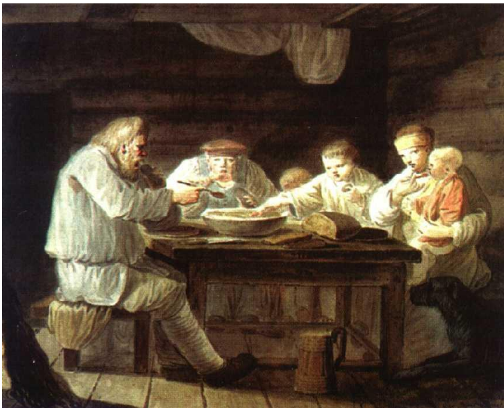
Крестьяне за обедом