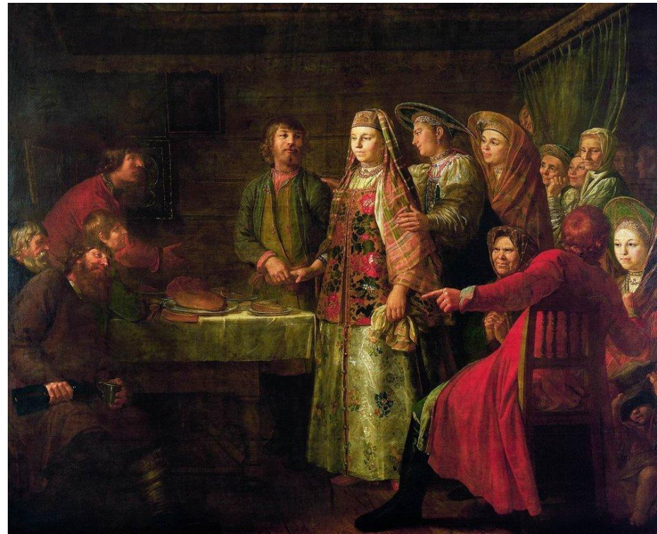
Празднество свадебного договора