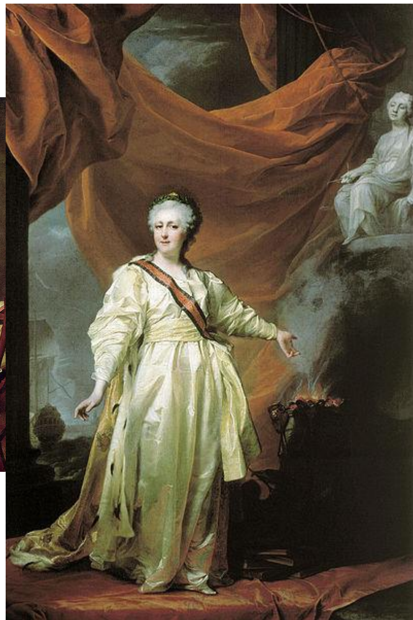
Екатерина II в виде законодательницы