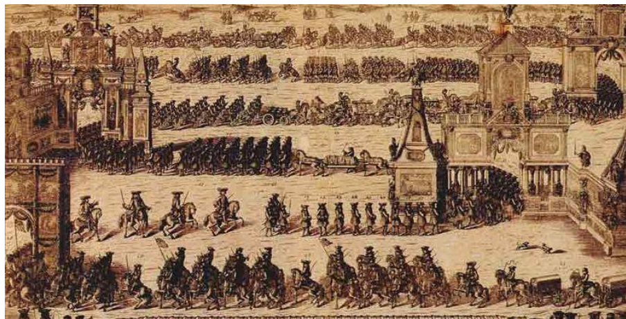
Торжественное вступление русских войск в Москву после Полтавской победы 21 декабря 1709 г