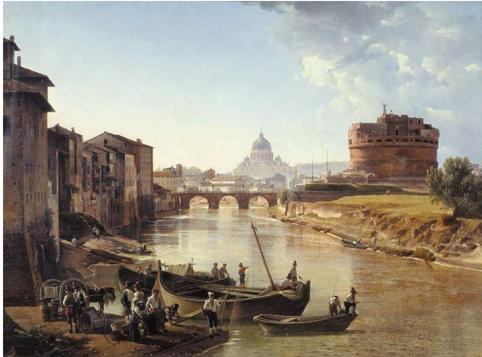
Новый Рим. Замок святого Ангела