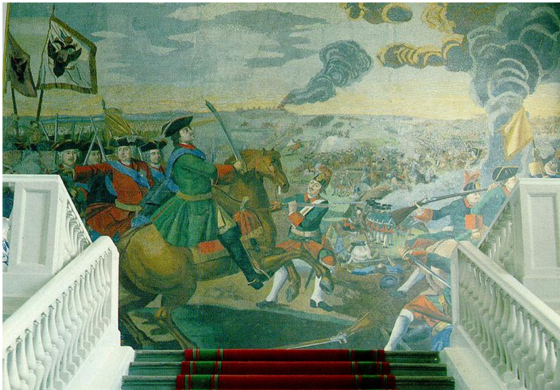
«Полтавская баталия». Мозаика М. В. Ломоносова в здании Академии Наук. Санкт-Петербург. 1762—1764