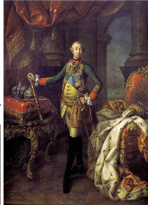
Портрет Петра III