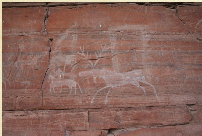
Шишкинские писаницы (на Урале)

Кроме наскальной живописи есть Петроглифы — высеченные изображения на каменной основе (от др.-греч. πέτρος — камень и γλυφή — резьба). Которые имеют самую разную тематику — ритуальную, мемориальную и знаковую.