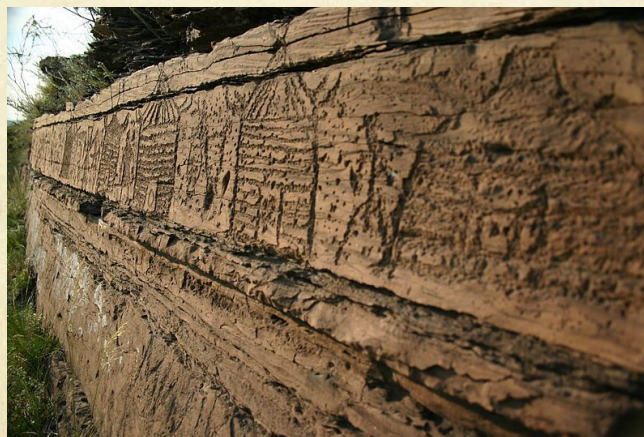
Малая Боярская писаница