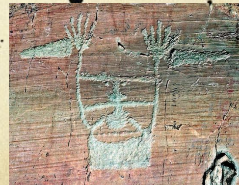
Долина чудес (Франция)