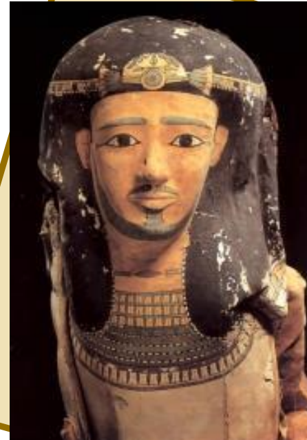
Маска мумии вельможи