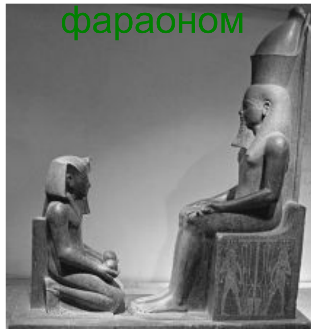
Вельможа перед фараоном