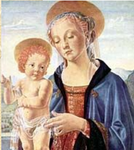
Андреа Верроккио. Мадонна с младенцем. 1470-1475 годы. Метрополитен-музей в Нью-Йорке.

Леонардо родился в семье богатого нотариуса. Он сложился как мастер, обучаясь у Андреа дель Верроккьо в 1467-1472 годах. Методы работы во флорентийской мастерской того времени, где труд художника был тесно сопряжен с техническими экспериментами, а также знакомство с астрономом П. Тосканелли способствовали зарождению научных интересов юного Леонардо.