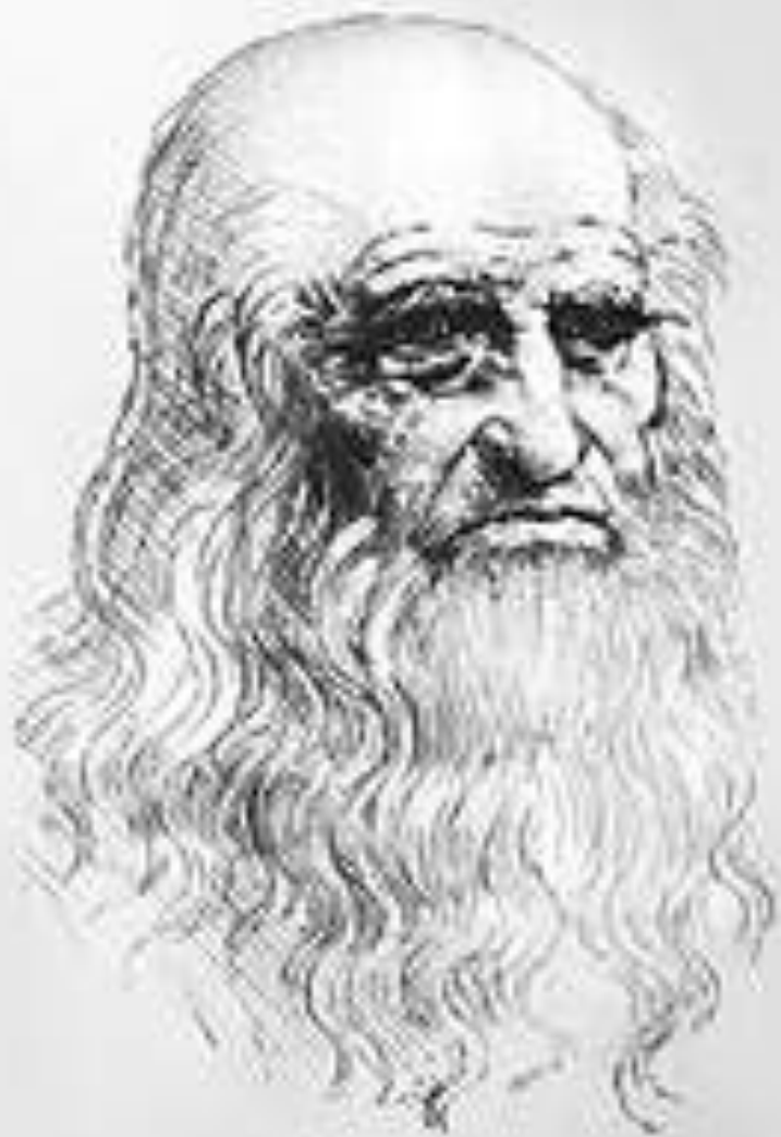
Леонардо да Винчи. «Автопортрет» (около 1510-1513). Библиотека, Турин.