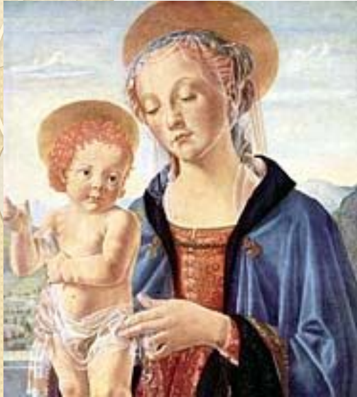
Андреа Верроккио. Мадонна с младенцем. 1470-1475 годы. Метрополитен-музей в Нью-Йорке.

Леонардо родился в семье богатого нотариуса. Он сложился как мастер, обучаясь у Андреа дель Верроккьо в 1467-1472 годах. Методы работы во флорентийской мастерской того времени, где труд художника был тесно сопряжен с техническими экспериментами, а также знакомство с астрономом П. Тосканелли способствовали зарождению научных интересов юного Леонардо.