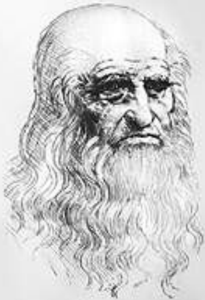
Леонардо да Винчи. «Автопортрет» (около 1510-1513). Библиотека, Турин.