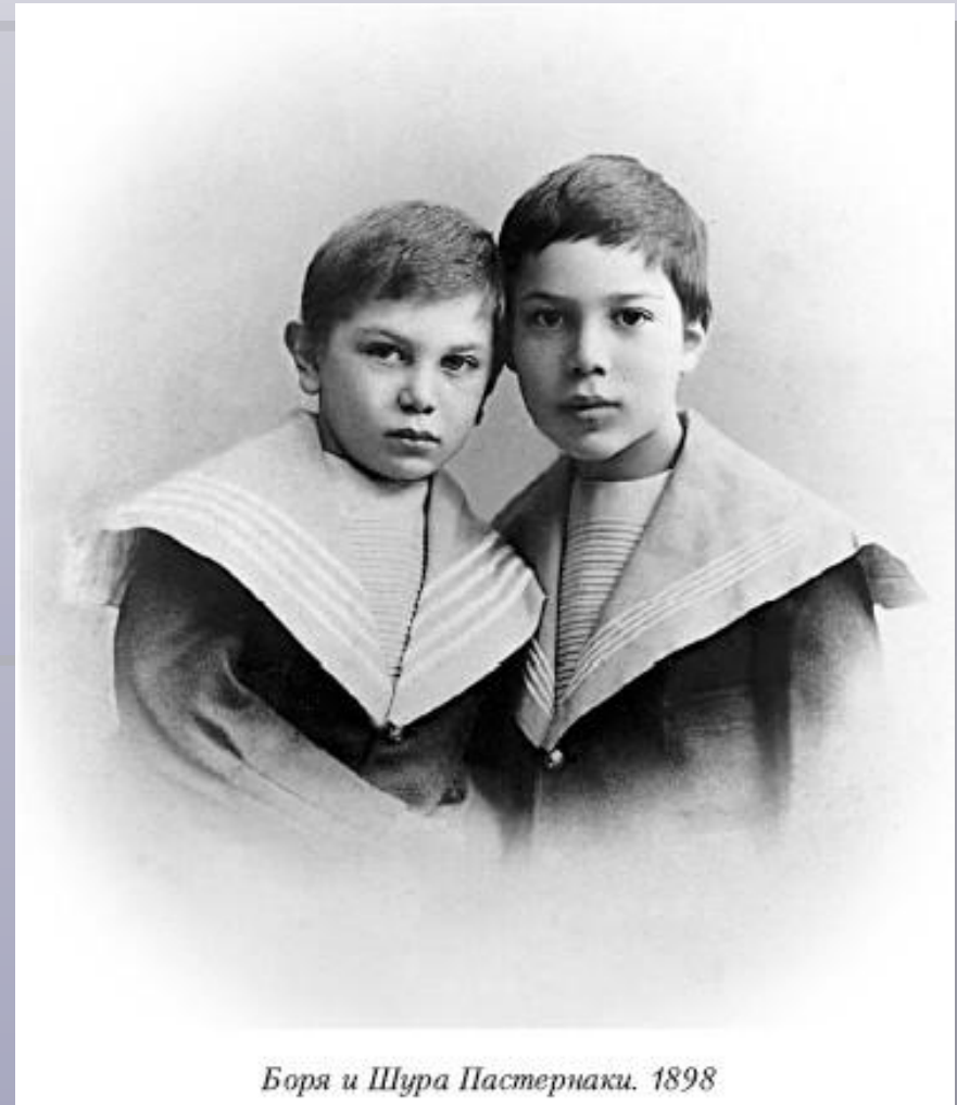
Боря и Шура Пастернаки. 1898