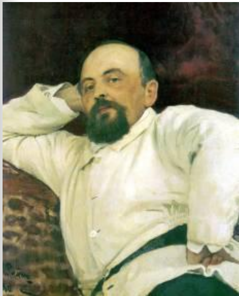
И.Е.Репин «Портрет С.И. Мамонтова»

Васнецов становится активным членом мамонтовского кружка художников, музыкантов, часто гостит в загородной усадьбе С.И.Мамонтова (богатого купца и покровителя художников) в селе Абрамцево.