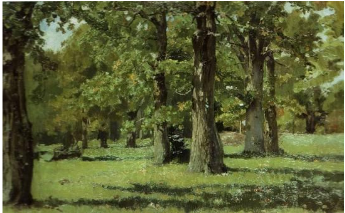
В.М.Васнецов «Дубовая роща в Абрамцево»