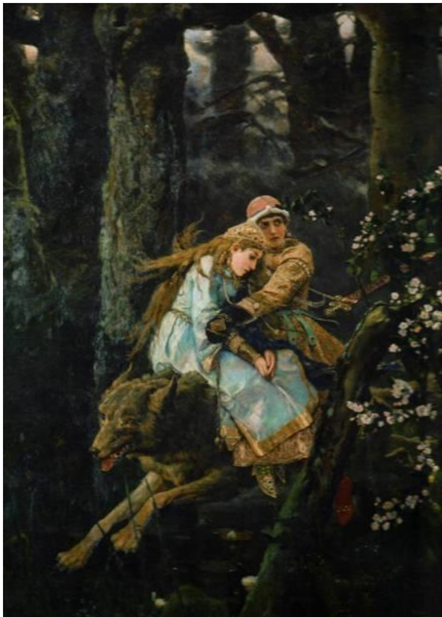
В.М.Васнецов «Иван царевич на сером волке»