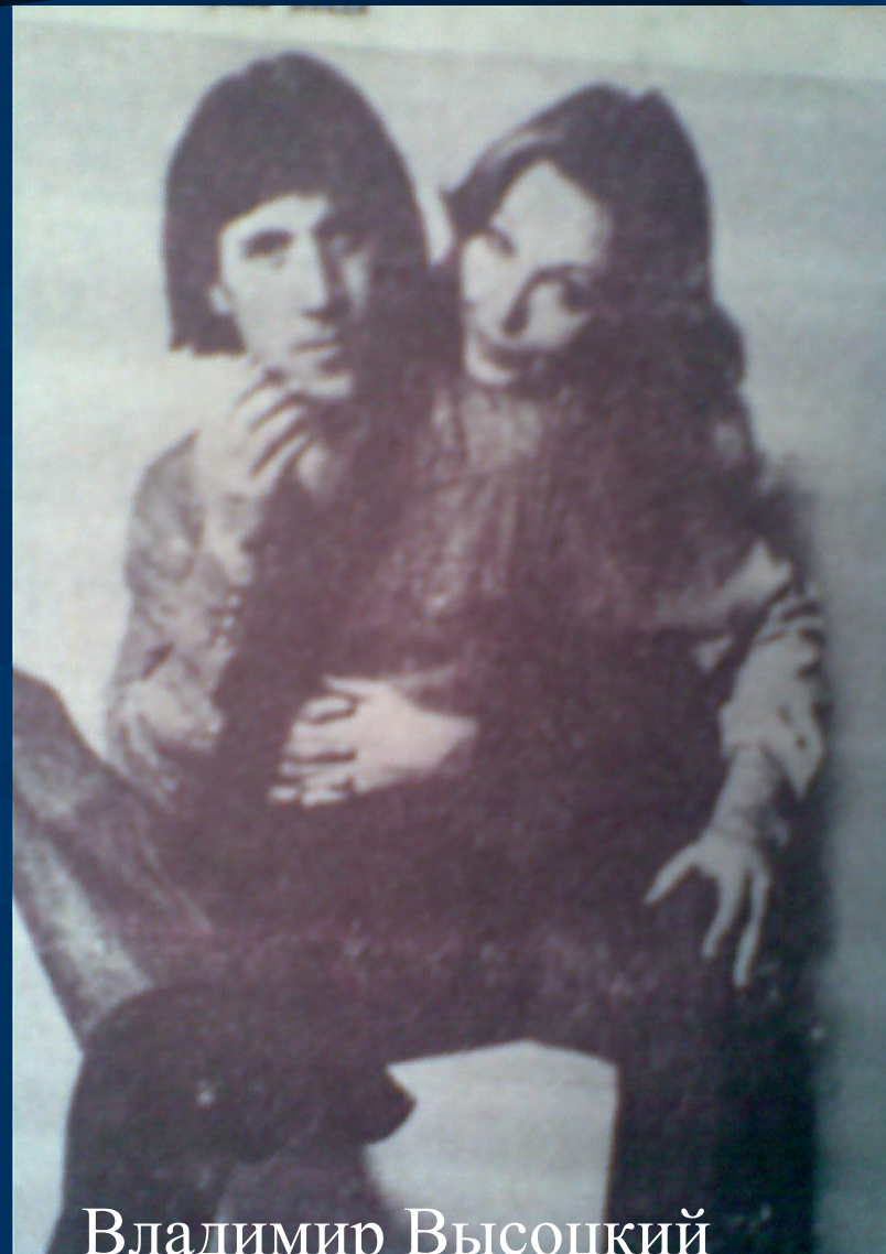
Владимир Высоцкий и Марина Влади

Актера-сочинителя с гитарой, поющего необычные по «вольности суждений» и манере исполнения песни, скоро заметили, он стал популярным.