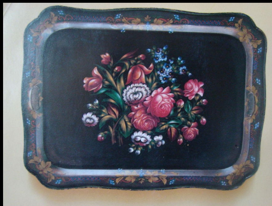
Поднос прямоугольный крылатый. И.С. Леонтьев. 1973г.