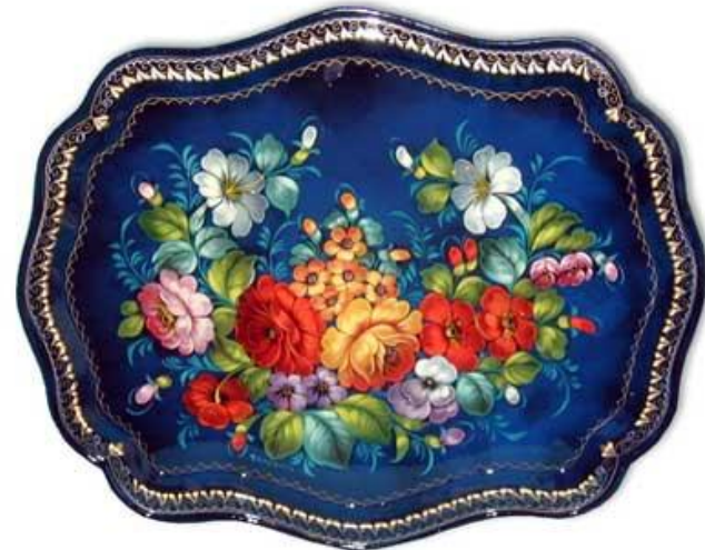
букет в раскидку