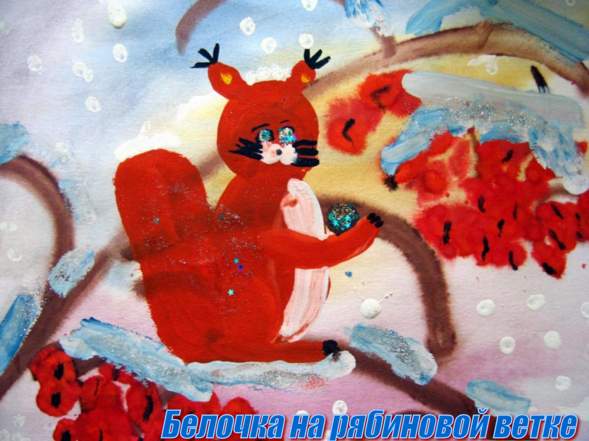
Белочка на рябиновой ветке