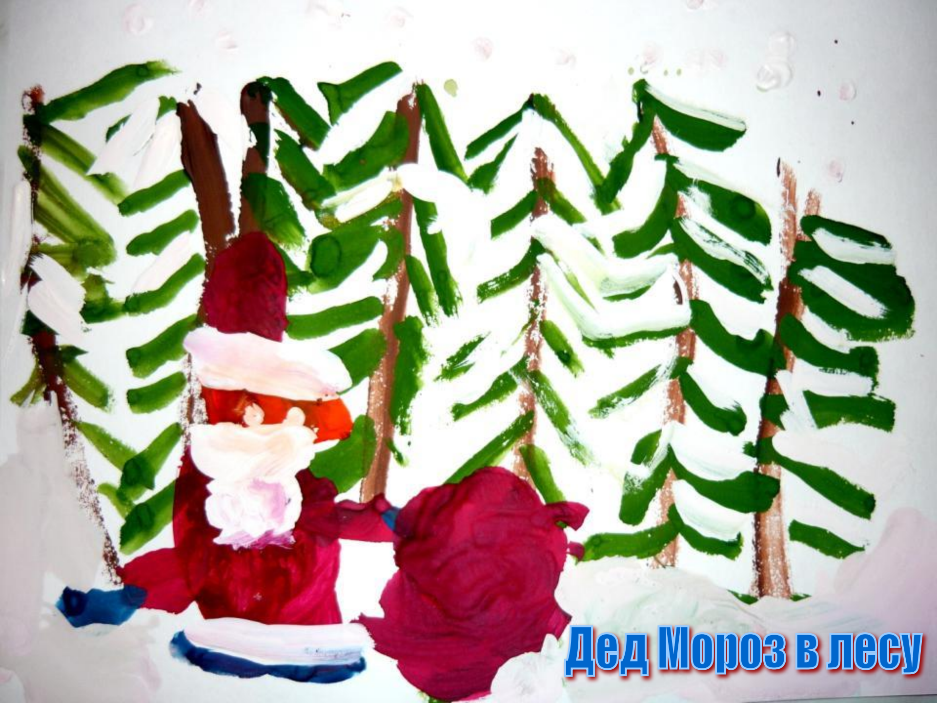
Дед Мороз в лесу