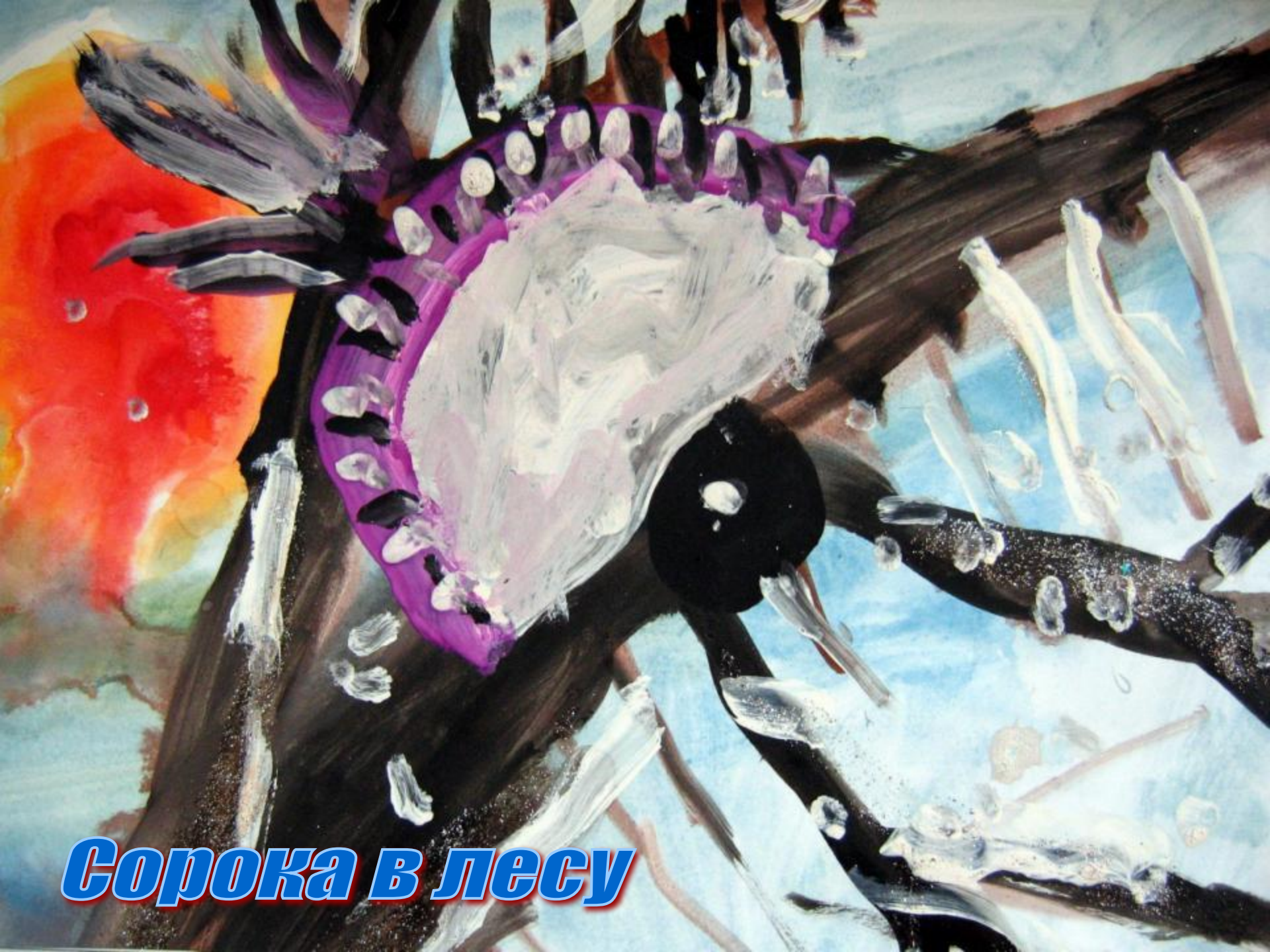
Сорока в лесу