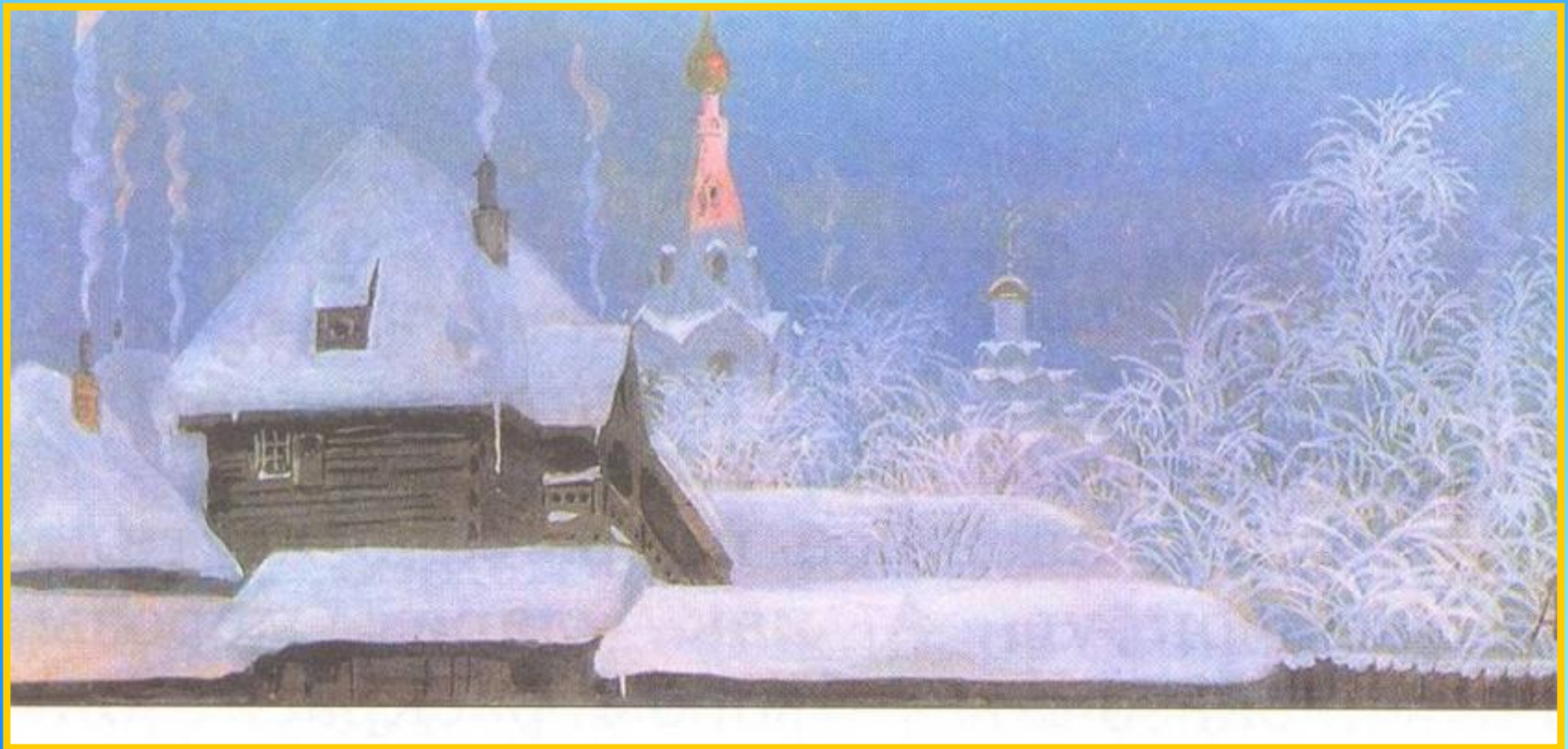
А. Рябушкин «Зимнее утро»