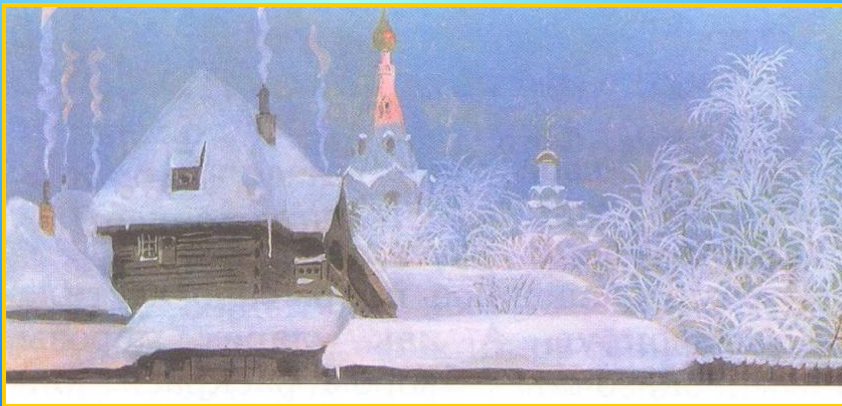
А. Рябушкин «Зимнее утро»