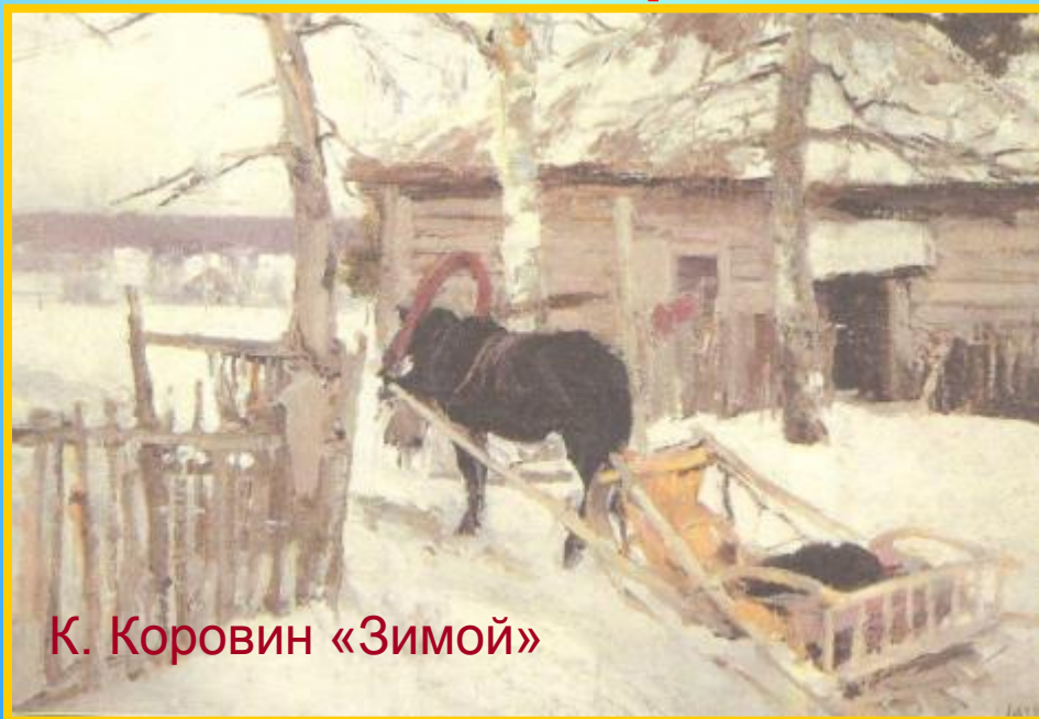
К. Коровин «Зимой»