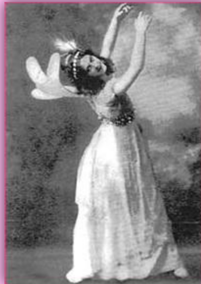
На американской танцовщице Айседоре Дункан