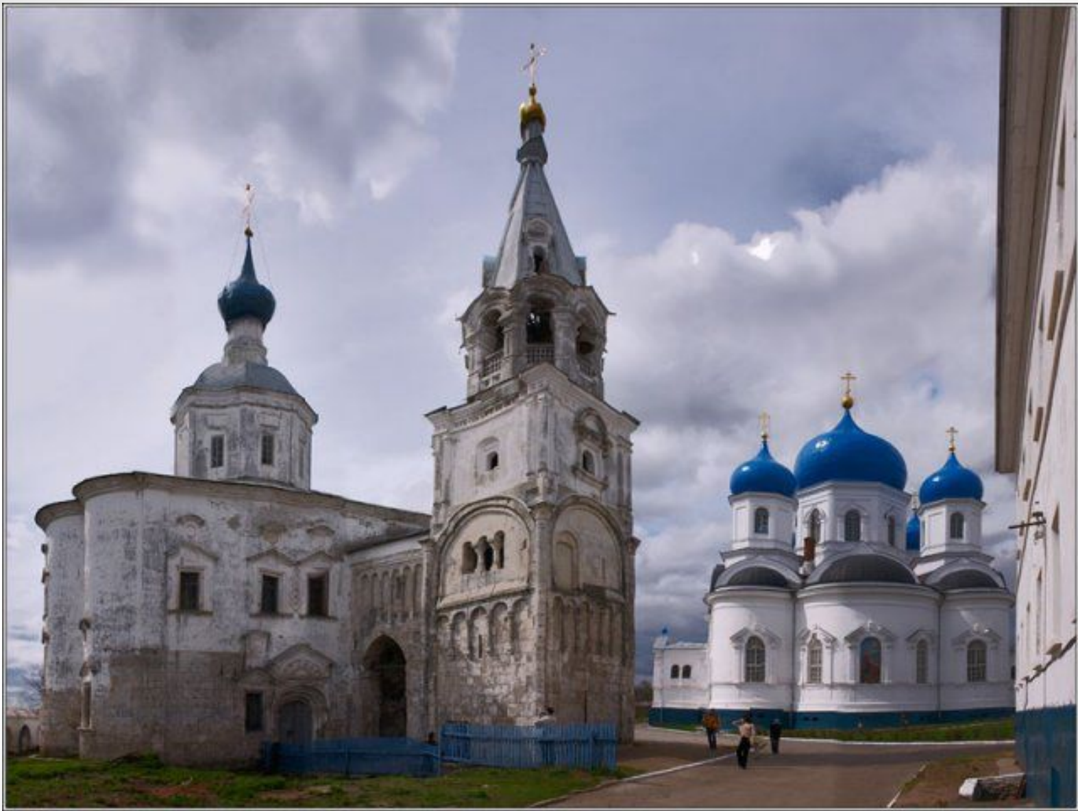
Храм Рождества Богородицы и Лестничная башня