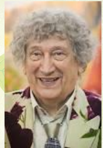
Ю.С. Энтин (год рождения - 1935)