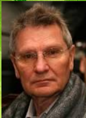
Д.Ф. Тухманов (год рождения - 1940)