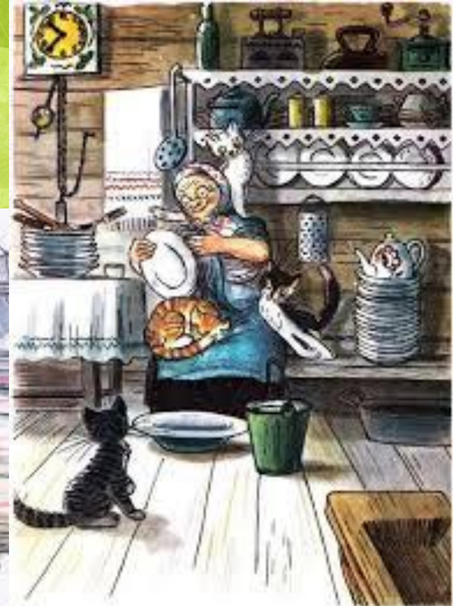
В.Г. Сутеев (1903 - 1993)