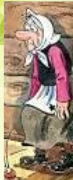
Музыкальное произведение «Элегия»