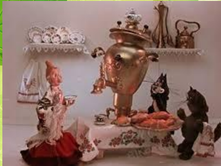
Песня «Пых-пых самовар»