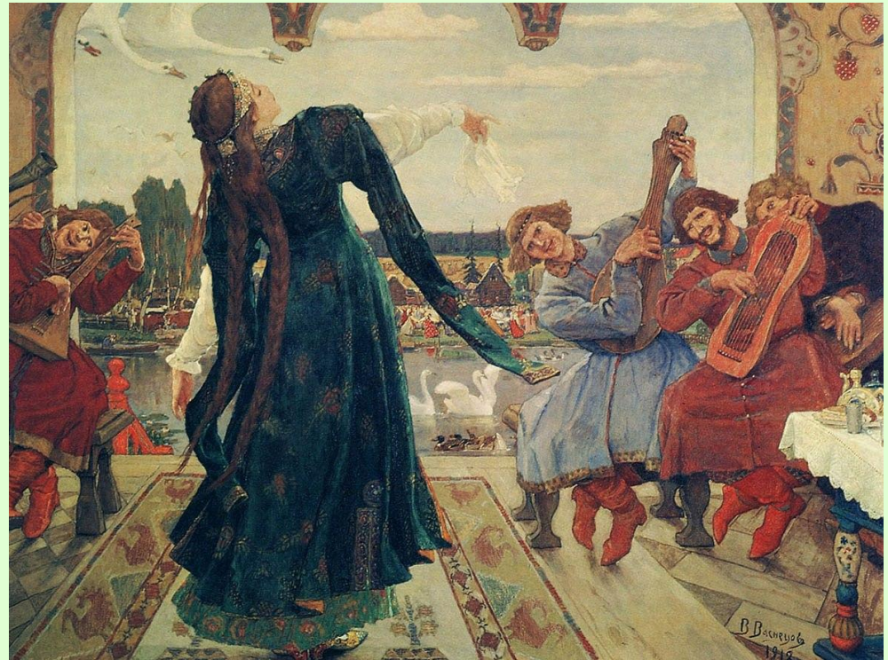
Иллюстрация к сказке «Царевна-лягушка»