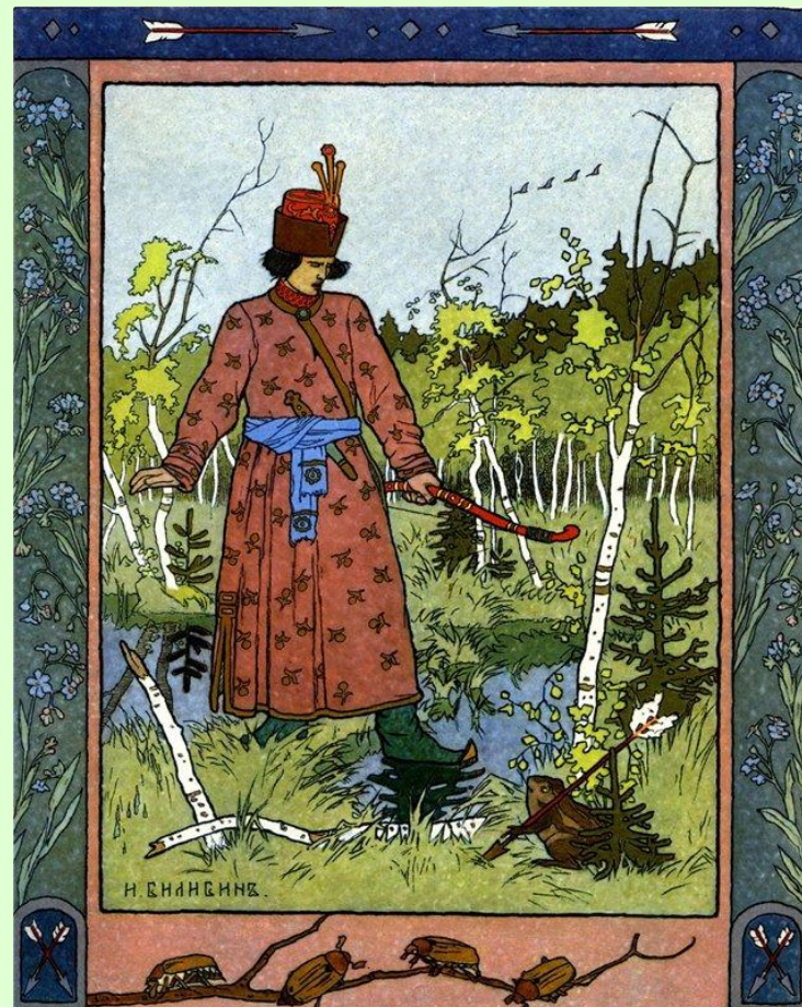
Иллюстрация к сказке «Царевна-лягушка»