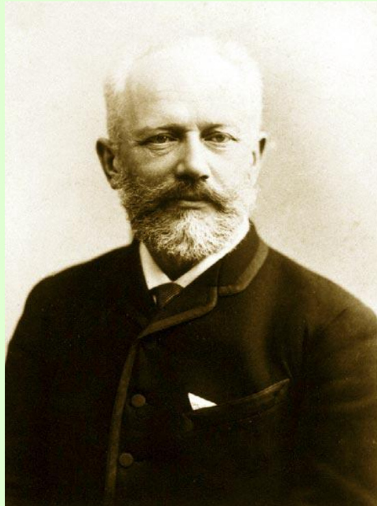
П.И. Чайковский (1840-1893)

«... как пошла Василиса Премудрая танцевать с Иваном-царевичем, махнула левой рукой – сделалось озеро, махнула правой – и поплыли по воде белые лебеди».