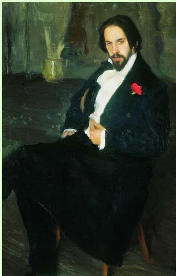
И.Я. Билибин (1876-1942)

«Пустил младший брат – попала стрела в грязное болото, и подхватила её лягушка-квакуша».