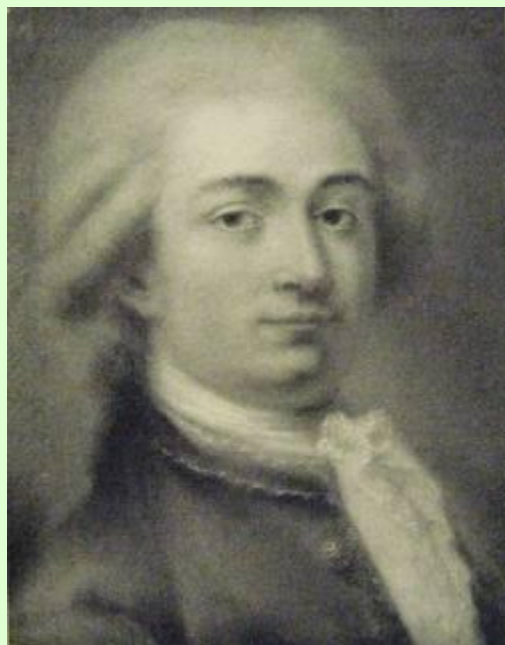
А. Вивальди (1678 - 1741)

«... как услышишь стук да гром – скажи: это моя лягушонка в коробчонке едет».