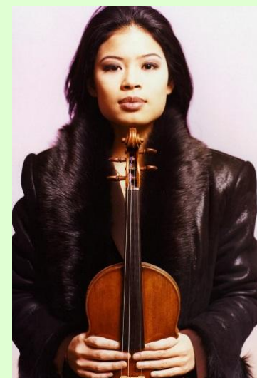
Ванесса Мэй (год рождения – 1978)