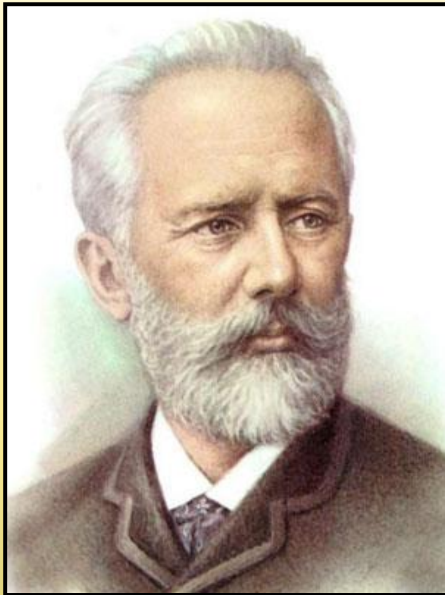
П.И. Чайковский «Детский альбом»