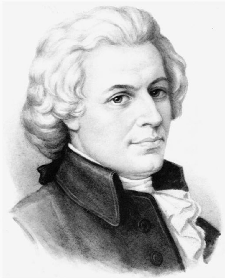
Моцарт Вольфганг Амадей (1756 - 1791)