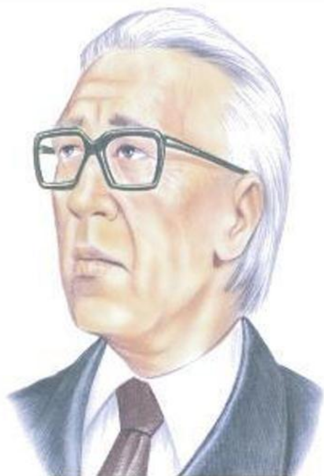
КАБАЛЕВСКИЙ Дмитрий Борисович (1904 – 1987)