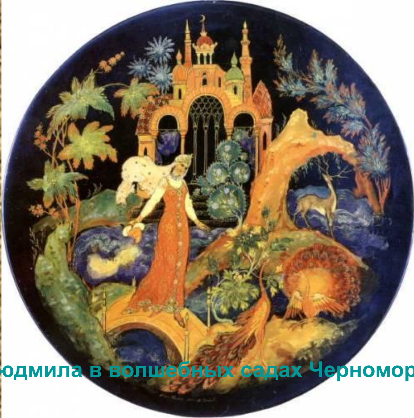
Людмила в волшебных садах Черномора