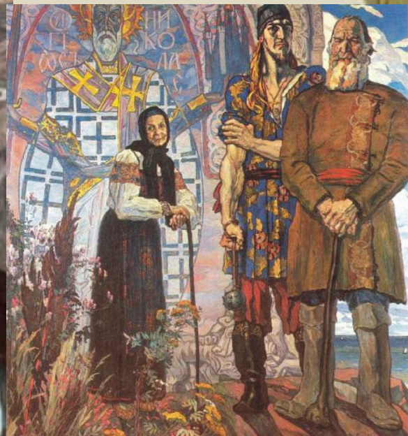
Павел Корин Александр Невский (1912)