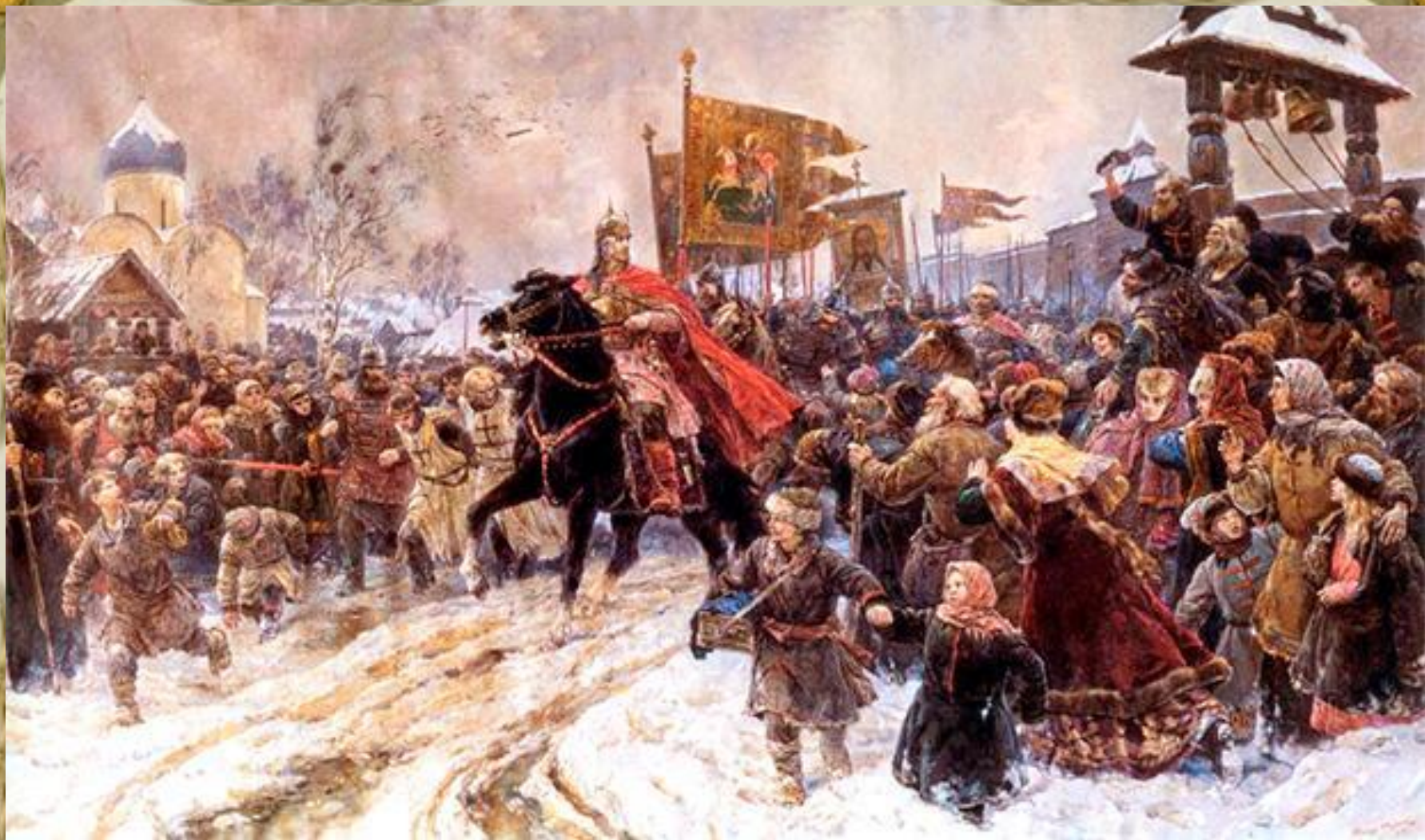
Владимир Серов Въезд А. Невского в Псков (1945)