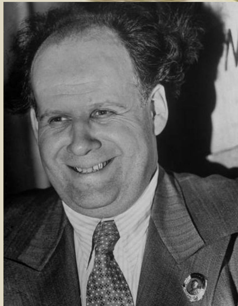
С. Эйзенштейн (1898 – 1948)