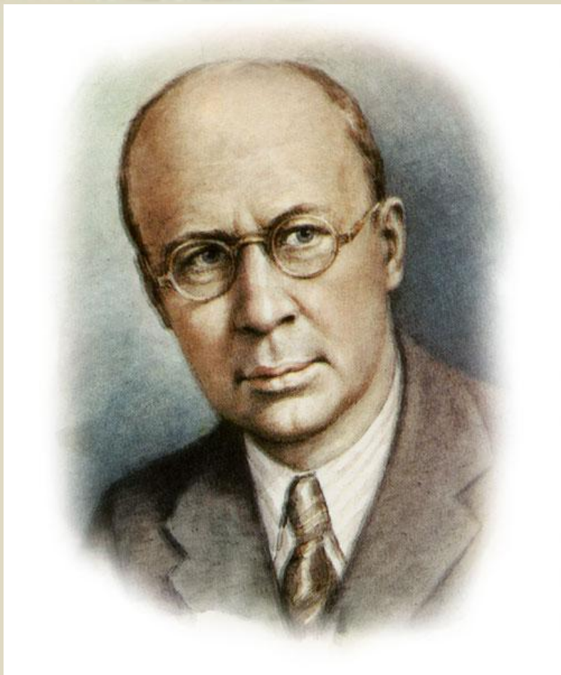
С. Прокофьев (1891 – 1953)