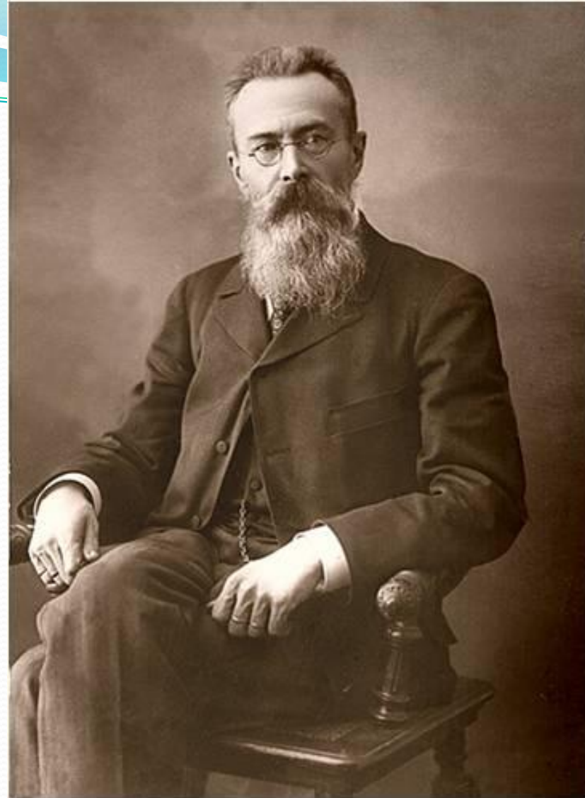
Н.А.Римский – Корсаков (1844 – 1908)

Ученый Морской офицер Титулярный советник