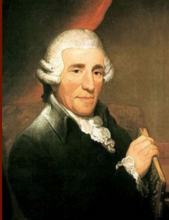
Вольфганг Амадей Моцарт