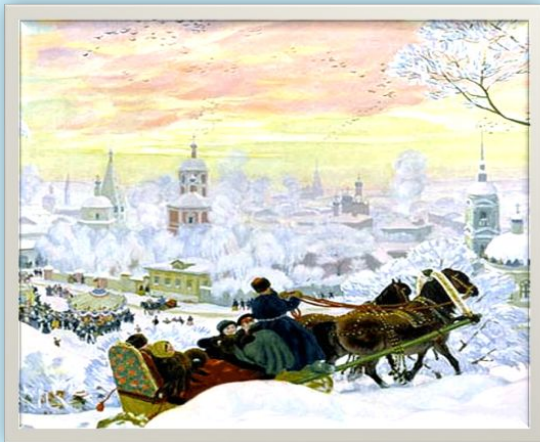
Б. М. Кустодиев «Масленица»