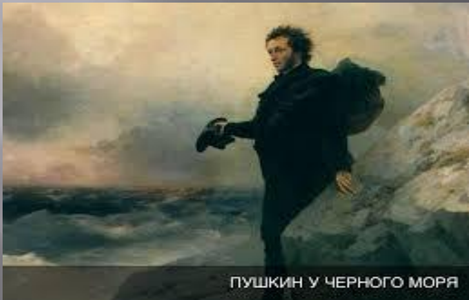
ПУШКИН У ЧЕРНОГО МОРЯ

Алекса́ндр Серге́евич Пу́шкин — русский поэт, драматург и прозаик. Ещё при жизни Пушкина сложилась его репутация величайшего национального русского поэта