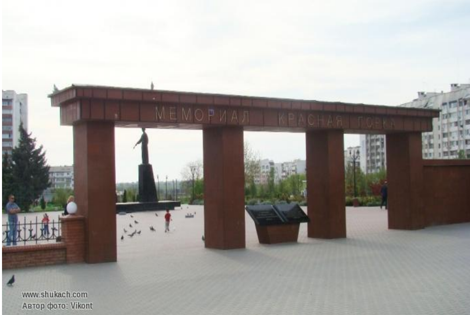
МЕМОРИАЛ «КРАСНАЯ ГОРКА», г. ЕВПАТОРИЯ