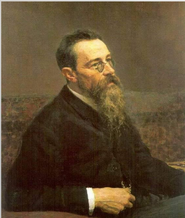
Николай Андреевич Римский- Корсаков