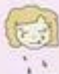
Рисунок Гурьевой Софии

Они все очень любили куклу! Куклу похоронили в саду, рядом с розовым кустом, а всю могилу украсили цветами.