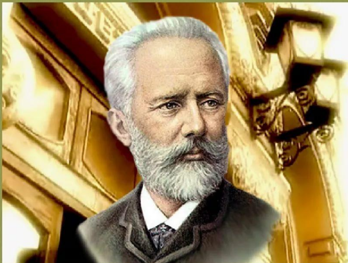
П.И.Чайковский – великий русский композитор