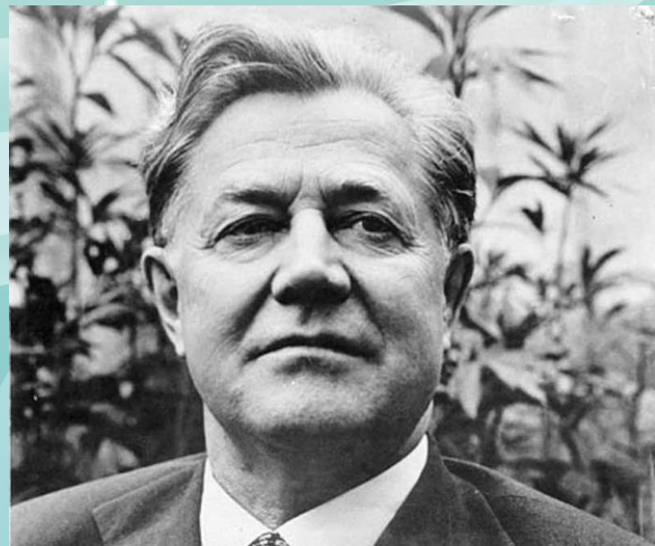
Алексей Александрович Сурков

Вспоминая об этом времени, поэт Алексей Сурков писал: «Уже с первых дней войны стало слышно, что рядом с кованными строками «Идёт война народная, священная война» в солдатском сердце теплятся тихие лирические слова песенки «Синенький скромный платочек».