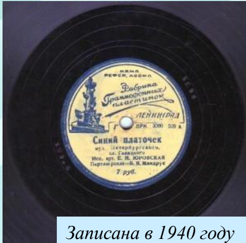
Записана в 1940 году

На пластинку в довоенные годы «Синий платочек» записан был только однажды.