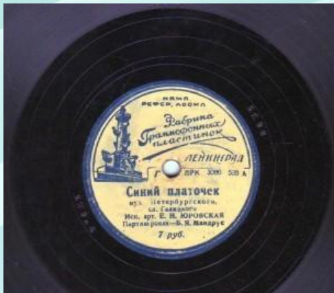
Записана в 1940 году