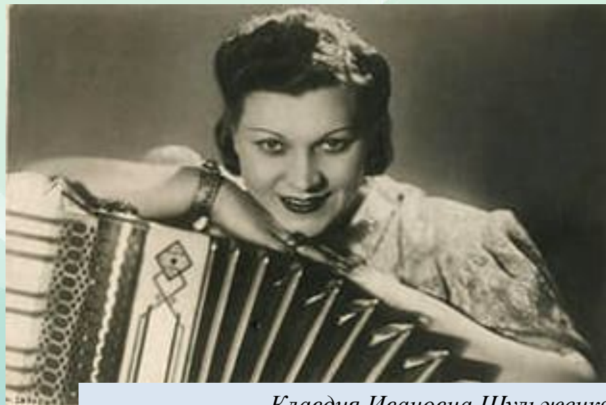
Клавдия Ивановна Шульженко

Самую широкую известность и распространение в годы войны получил, вне всякого сомнения, фронтовой вариант «Синего платочка», инициатором создания и первой исполнительницей которого стала замечательная наша певица, народная артистка Советского Союза Клавдия Ивановна Шульженко