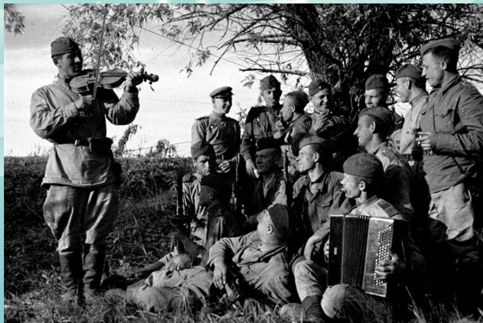
На фото: концерты на линии фронта