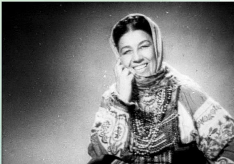
Лидия Андреевна Русланова

В августе 1942 года Лидия Андреевна Русланова записала вариант «Синего платочка» на грампластинку вместе с «Землянкой» К. Листова и А. Суркова. Однако, пластинке с этой записью суждено было увидеть свет лишь сорок лет спустя, в 1982 году, поскольку в войну были изготовлены лишь матрицы и сделан с них пробный оттиск, а в тираж она не пошла.