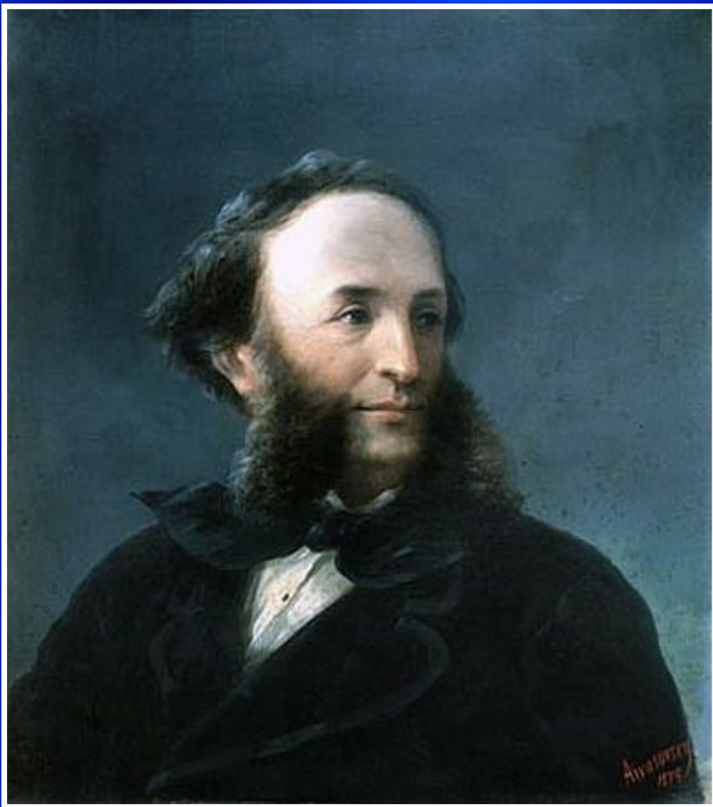
Иван Константинови ч Айвазовский (1817- 1900)