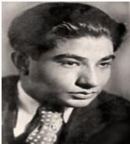
Актер, режиссер - Гамид Рустамов