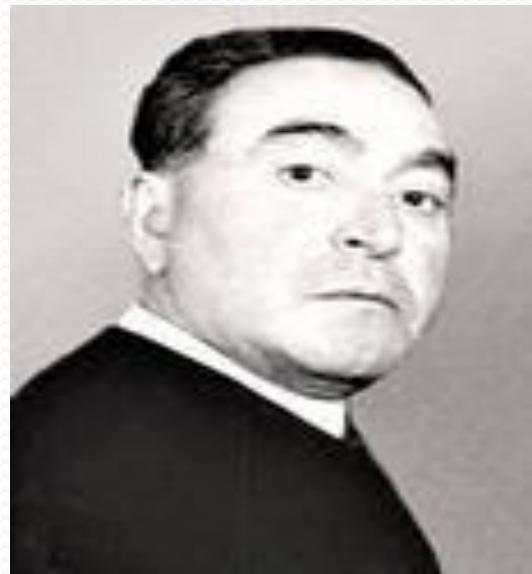
Заслуженный артист Советского Союза и кумыкского театра -Татам Мурадов