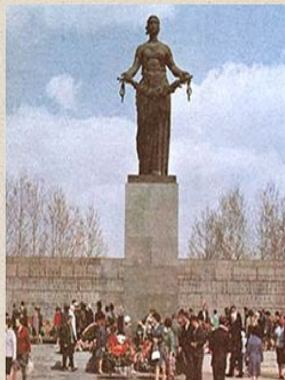
Скульптура "Родина-Мать на Пискаревском кладбище"

Ленинграда похоронено на Пискаревском мемориальном кладбище. На нем сооружен главный памятник блокаде.