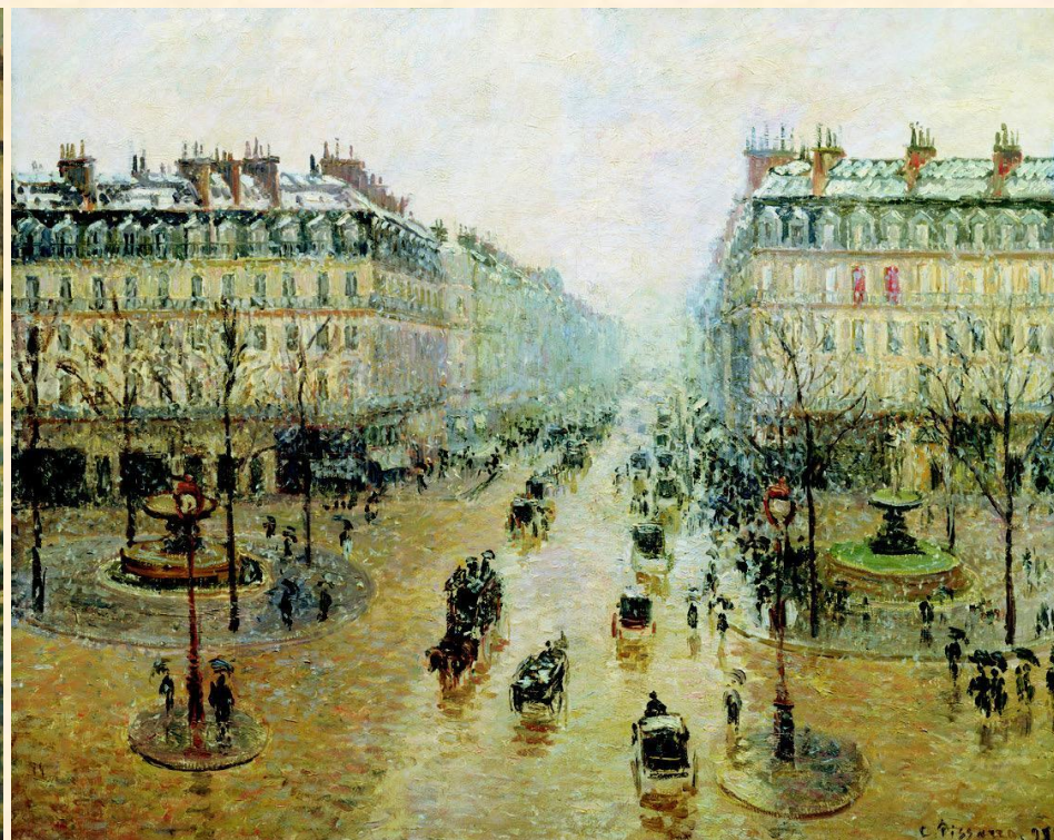
К. Писсарро «Оперный проезд в Париже. Эффект снега. Утро»