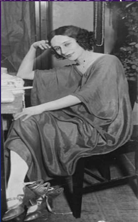
Тамара Карсавина (1885-1978)