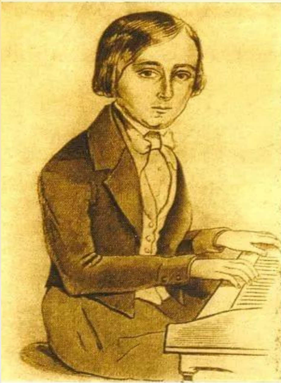
Сен-Санс в 1846 г.