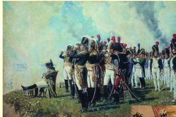
Наполеон на Бородинских высотах