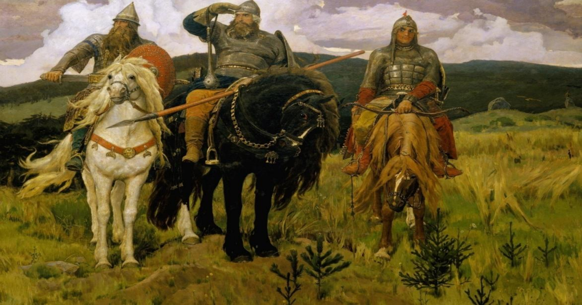
Художник Виктор Васнецов «Богатыри» 1898 год