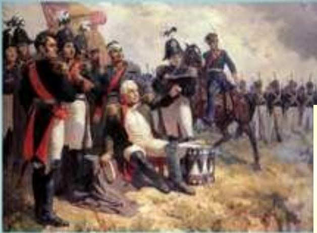
Художник А. Шепелюк. М.И. Кутузов на командном пункте в день Бородинского сражения