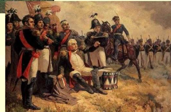
М. И. Кутузов на командном пункте в день Бородинского сражения