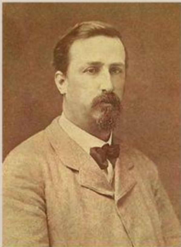
Александр Порфирьевич Бородин. Фотография 1873 года

Симфония № 2 (Богатырская) А.П. Бородина. 1869-1876