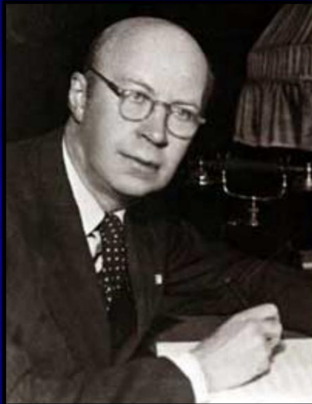
С. С. Прокофьев