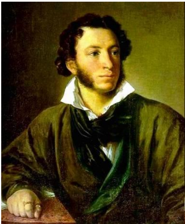
Александр Сергеевич Пушкин (1799 – 1837)

«Мороз и солнце; день чудесный! Ещё ты дремлешь, друг прелестный...»