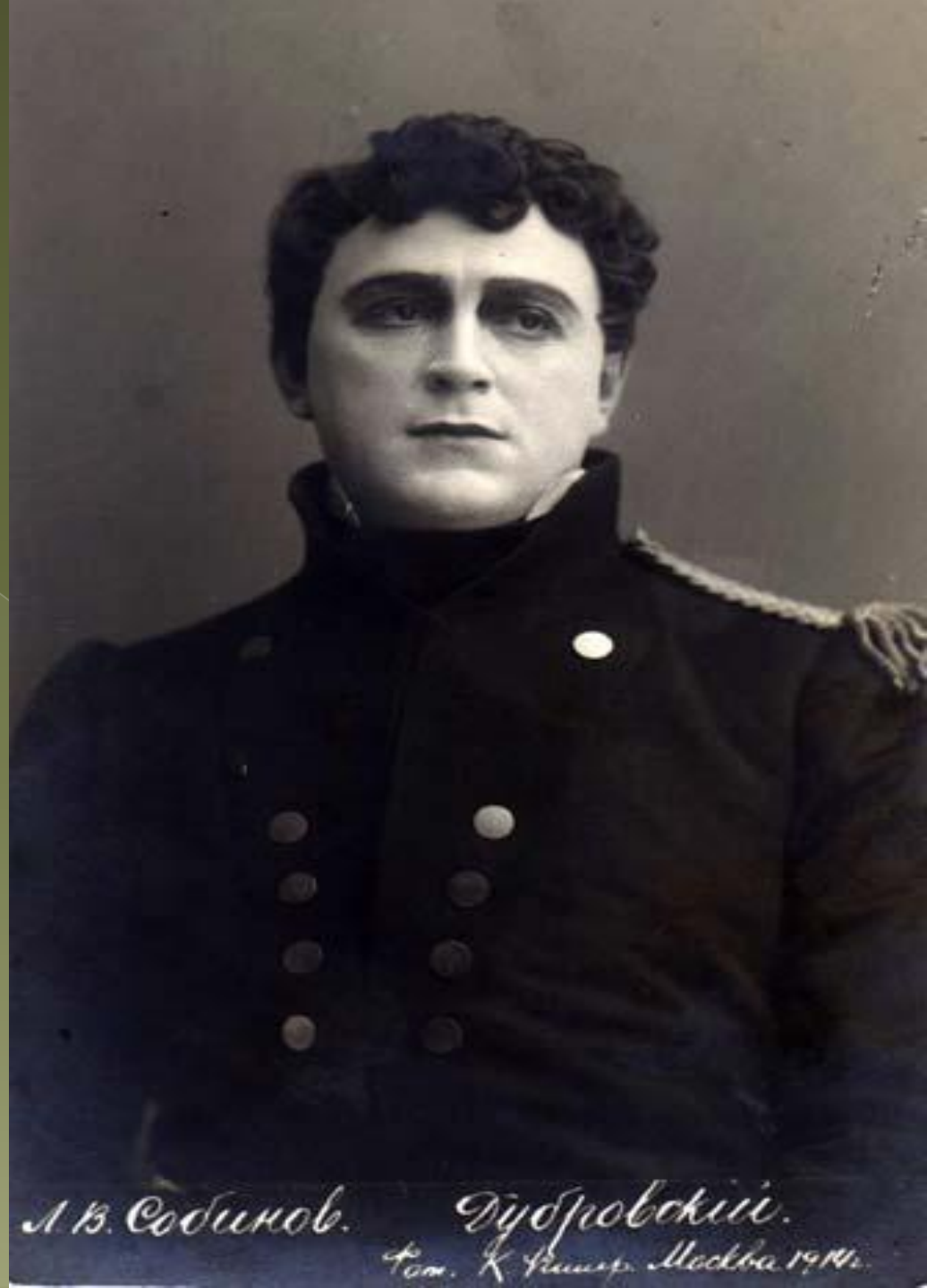
Л. В. Собинов. Дубровский. Москва 1914.