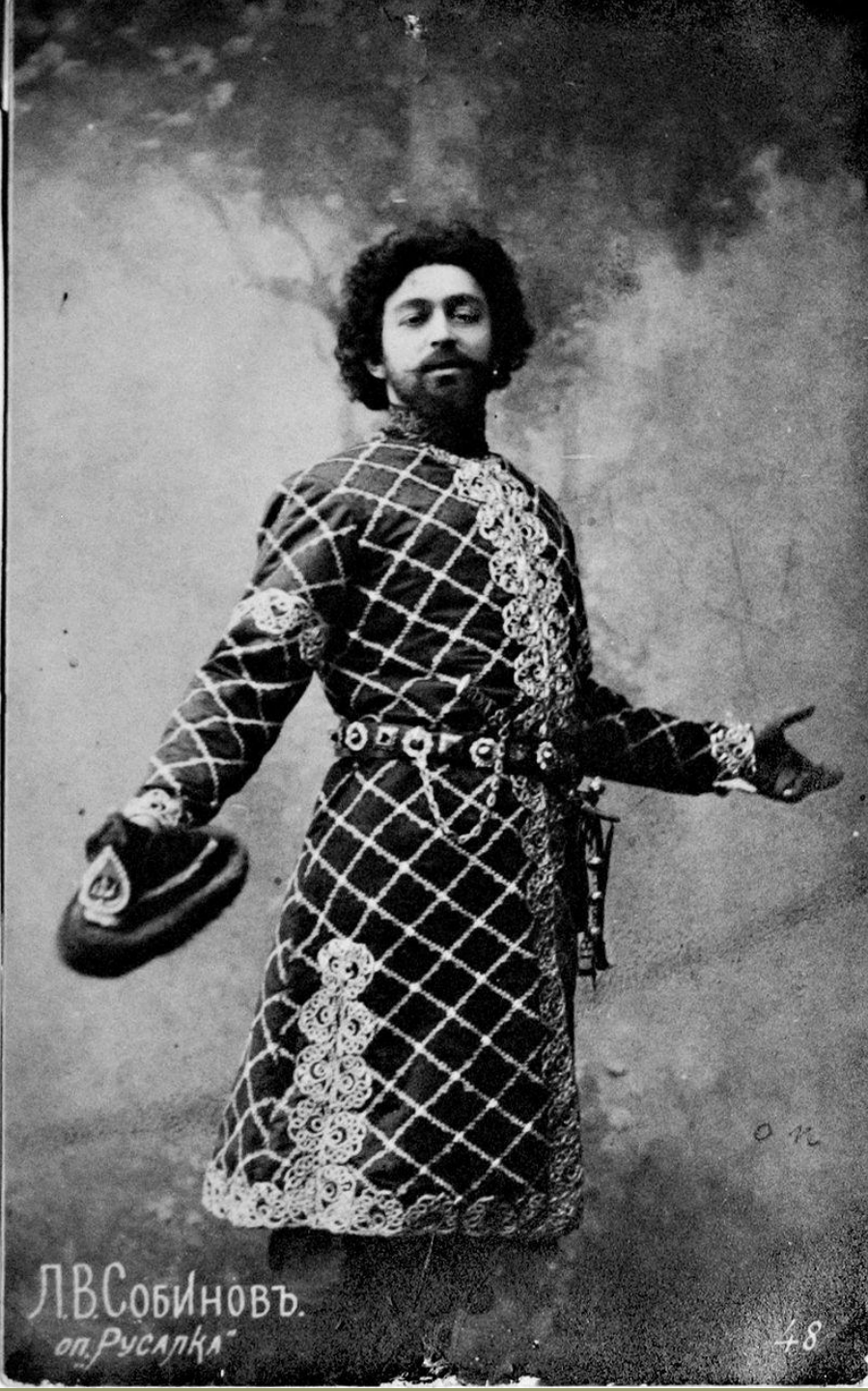
Л.В.СОБИНОВЪ. оп. Русалка