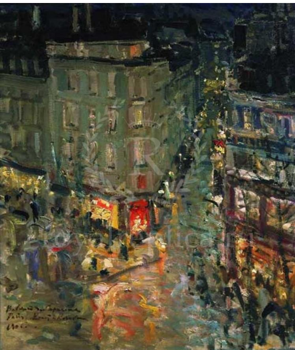
К.Коровин Париж. Бульвар капуцинок.

Ведущий представитель музыкального импрессионизма . Симфоническая картина «Море». Шуточный «Кэк уок». Ноктюрны «Празднества», «Облака», «Сирены».