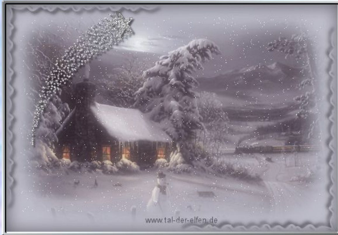
Иллюстрация к пьесе «Бубенчики»