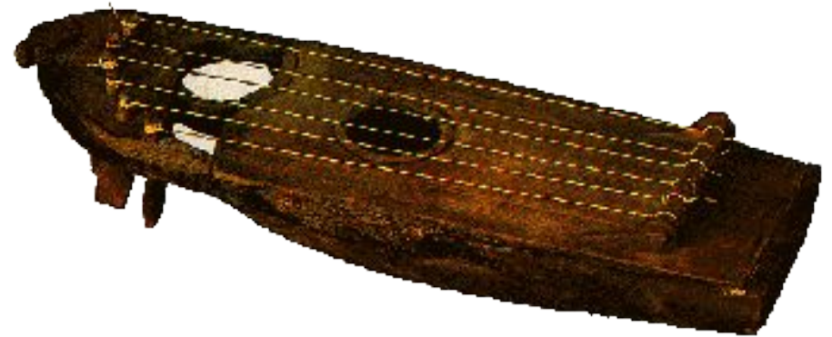
Крыловидные (звончатые, яровчатые)