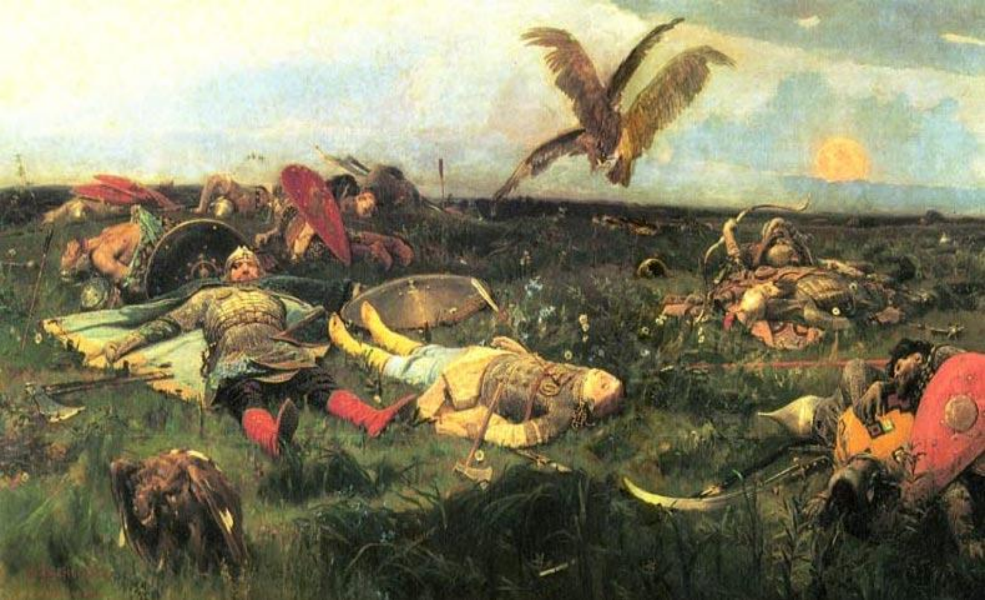
Васнецов «После побоища Игоря Святославовича с половцами»