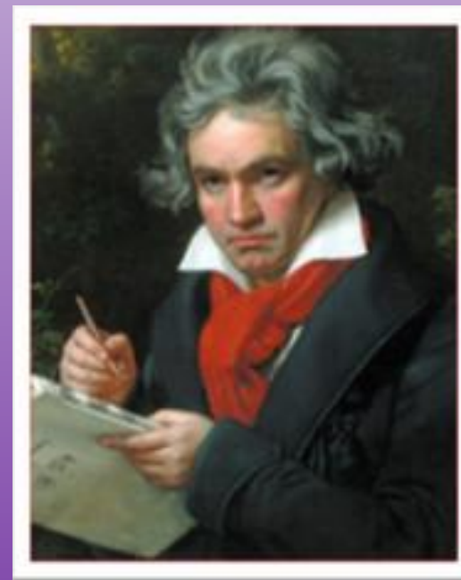
Людвиг ван Бетховен