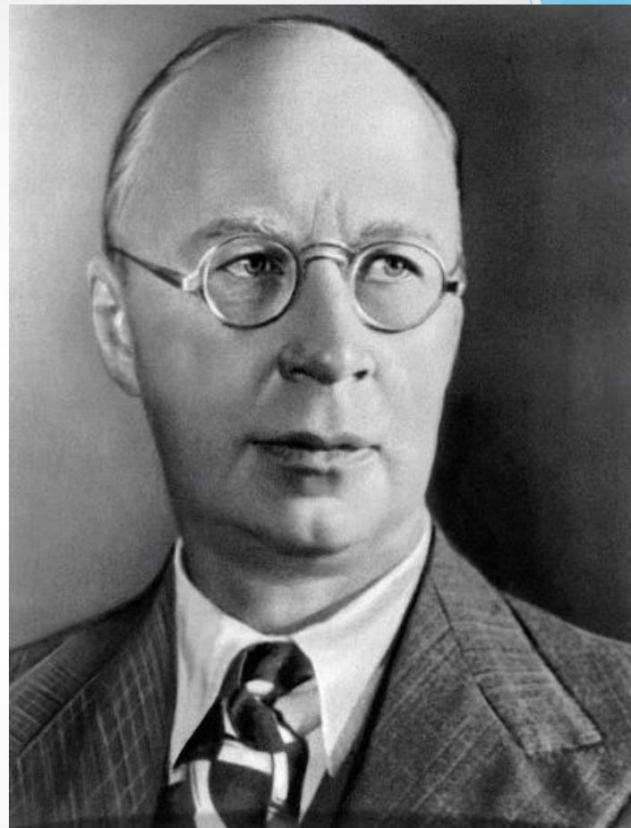
С. С. Прокофьев (1891-1953)