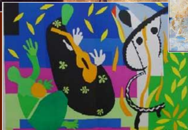
Музыка XX в.